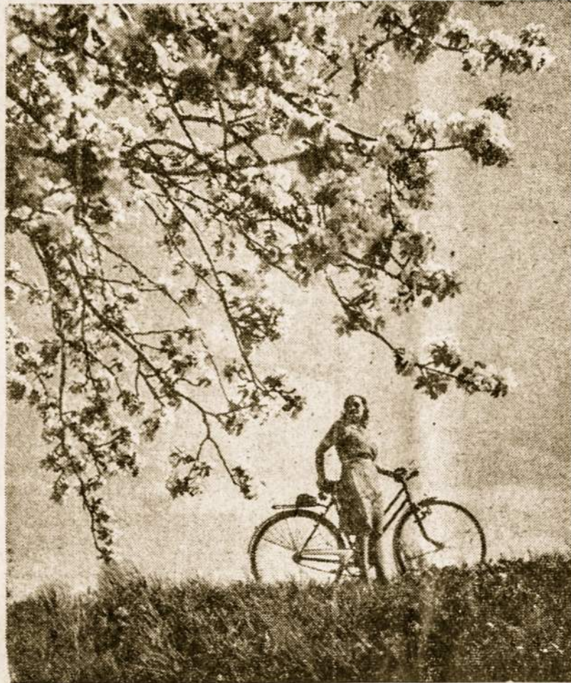
Su pavasariu — džiaugimas ir žiedai

kių, aštrių spindulių ir pervargimo. Pailsinkite akis kuo dažniau kas pusvalandį pertraukdama įtemptą žiūrėjimą. Nugręžkite akis nuo atimo objekto, dažniau