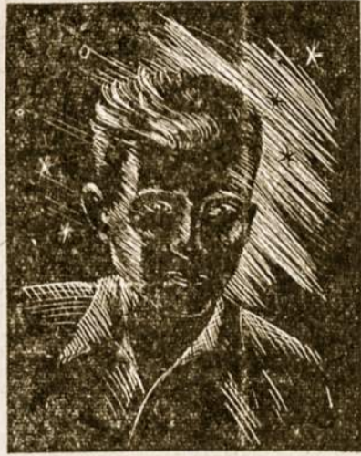
Poetas Vytautas Mačernis.

šiol atskirų leidinių išleista Vizijos pomirtinė knyga 1947 m. Mačernis tiek istoriškai, tiek kūrybiškai yra vienas pačių reikšmingiausių savo kartos poetų. Jis išsivadavo iš tuometinės formos prabildamas savitais žodžiais ir sava mintimi. Tiesioginiu savo mokytoju Mačernis laikė Valan-