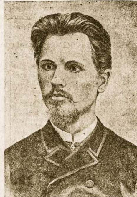
Dr. Vincas Kudirka didelis Lietuvos tautinės sąmonės žadintojas skinęs kelią Lietuvos laisvei.

Mums šiandien dar sunku atspėti, kada NKVD susekė "Romuvos" organizatorius ir pagrindinius vadus. Faktas, kad po Stalino mirties