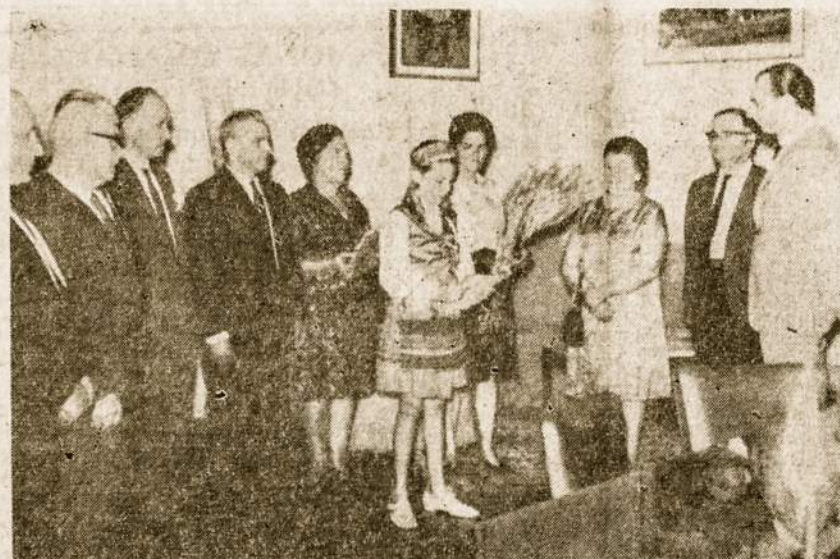
Rosario Liet. Bendruomenės delegacija aplanko Rosario Miesto vald. burmistrą (Aprašymas pusl. 7)