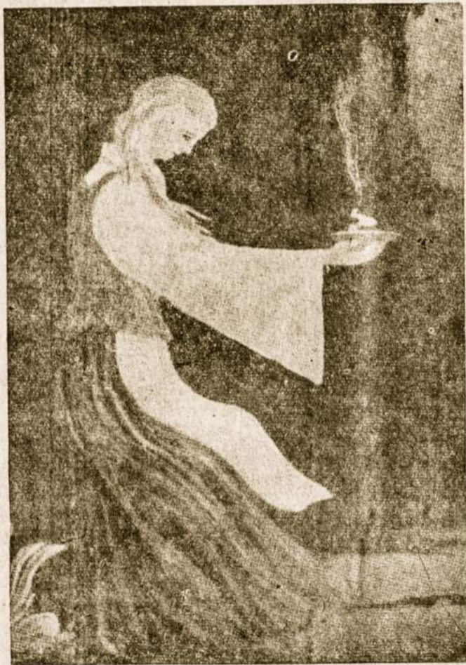
Lietuvaitės auka Tėvynei.