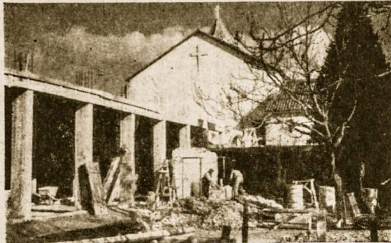
Kiekvienas darbas gali vesti žmones prie Dievo, jei atliekamas su gryna intencija.

Ar yra kokia nauda iš to darbo ir vargo? Juk vistiek