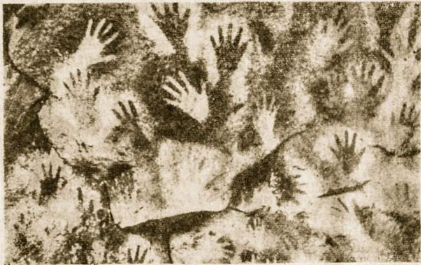
Patagonijos uolose išlikę senųjų gyventojų piešiniai siekia 27 - 30.000 metų amž.

negatyvūs — ranka uždedama ant uolos sienos ir apvedžiojama jos ir pirštų kontūrai,