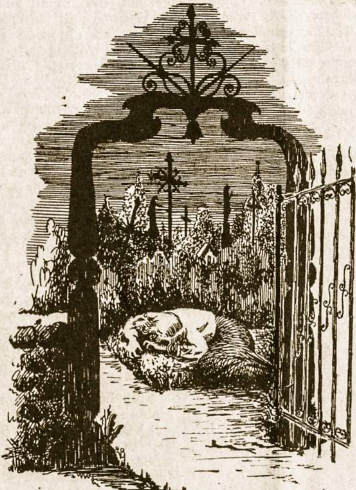
Skaumas ir vienuma — dažni žmogaus palydovai.