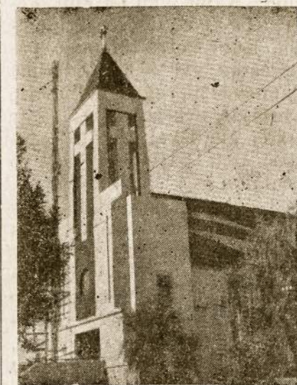
Urugvajaus Lietuvių Fatimos vardo bažnyčia.