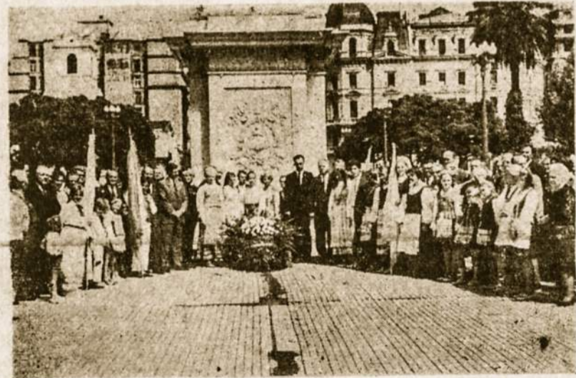
Padedant vainiką prie Laisvės piramidės Vasario 16 d. minėjimo metu, vadov. A.L.O.S. aTrybai.