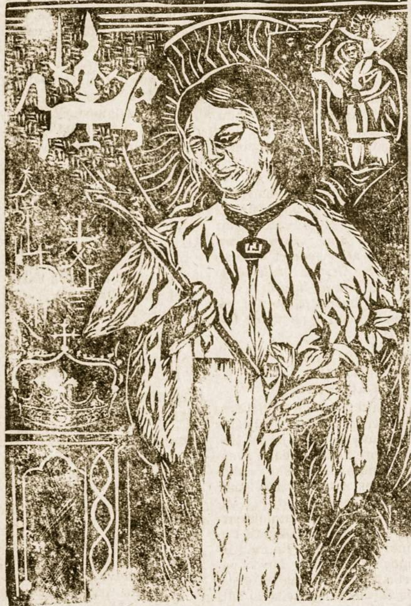
Šv. Kazimieras — Lietuvos Patronas.

Štai mūsų tautos patronas — Šv. Kazimieras atsisakė