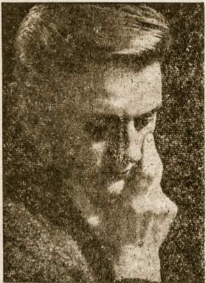
Režisorius Entrikas Ryma.