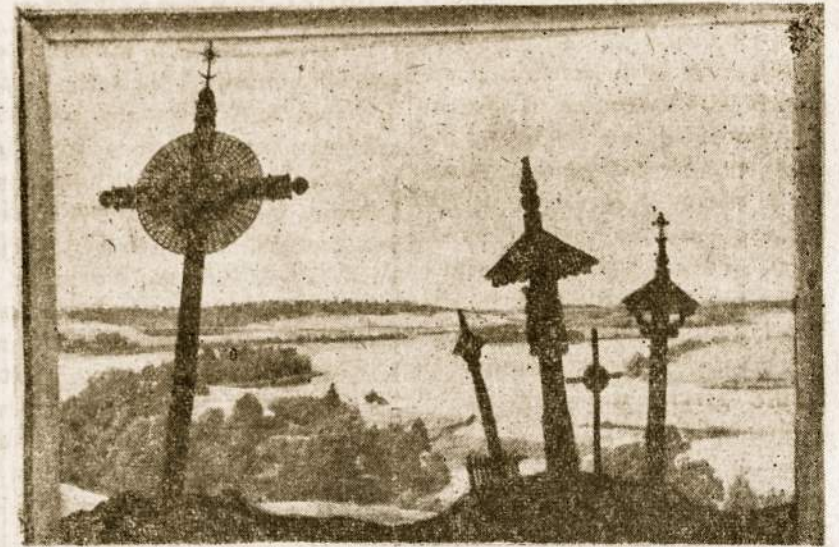
Mūsų gražioji Lietuva - kryžiai prie ežero.

• Lapkričio 4 d. Vilniuje buvo atidarytas naujas tiltas per Neries upę. Šis tiltas jungia miesto centrą su naujuoju Vilniaus priemiesčiu - Lazdynų rajonu.