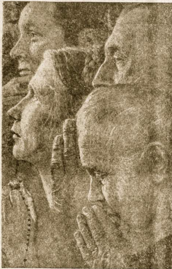
Susitelkime ir maldoje ateina Šv. Dvasia.

pilnume Sekminių dienoje, kai susikūrė pirmoji krikščionių bendruomenė Jeruzalėje ir vėliau išsiplėtė po platų pasaulį. Šv. Dvasios vedami ir jos įkvėpti išėjo apaštalai skelbti Kristaus Evangeliją, kurią vėliau tos pa-