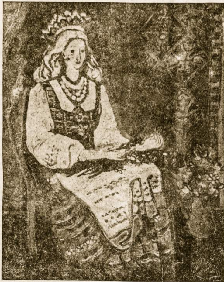
Lietuvaitė — portretas.

• D. Britanijoje patys didžiausi knygų skaitytojai yra kaliniai. Bibliotekų statistika rodo, kad vidutiniškai kiekvienas kalinys per metus perskaito 250 knygų.