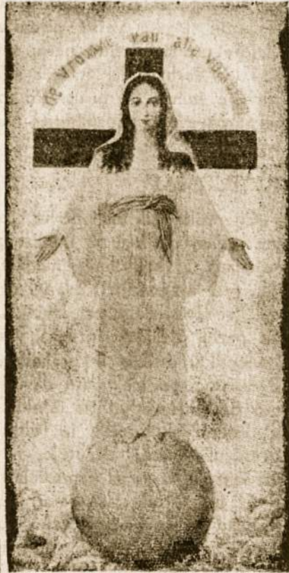
Marija — Tautų Motina.

Kadangi Marija yra Kristaus tikroji motina, tai tuo pačiu ji yra ir visos atpirktos žmonijos