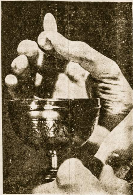
Kristus yra pasaulio gyvoji duona, o kunigas yra tarpininkas tarp Dievo ir žmonių.

Savo protu žmogus pakyla virš visos sukurtos gamtos, gali net jos paslaptis pažinti ir ją apvaldyti. Tiesa, žmogus nepasiekia niekad visos gamtos pa-