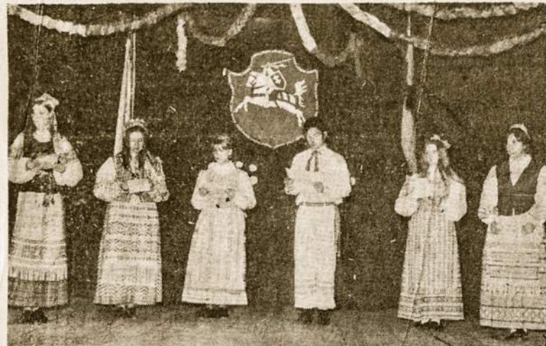
Išvežtųjų (21.6.70) minėjime meninę programą atliko "Ateities" ansamblis.

Sekantis posėdis rugp. 7 d. SLA patalpose.