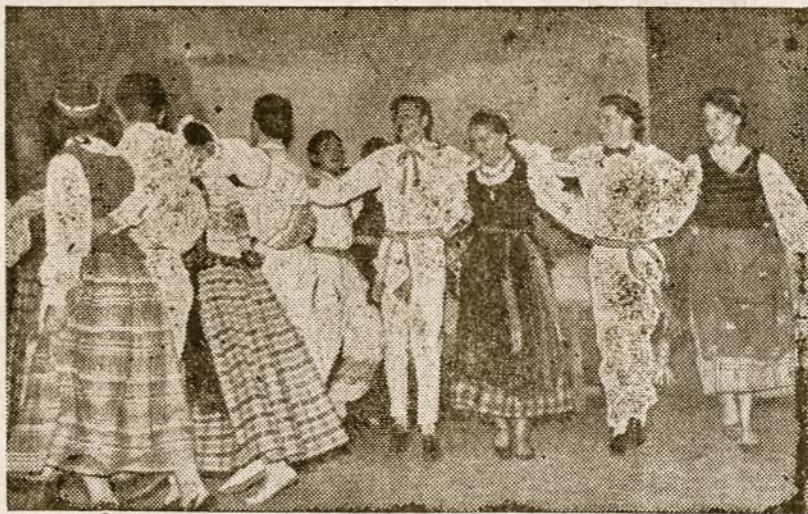
Taut. šokių ansamblis "Rambynas" vyksta į Kordobą dalyvauti "Lituania" gatvės atidaryme.