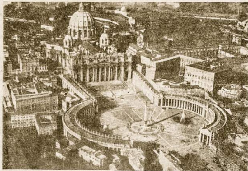
Šv. Petro bazilika, po kuria randasi liet. koplyčia.