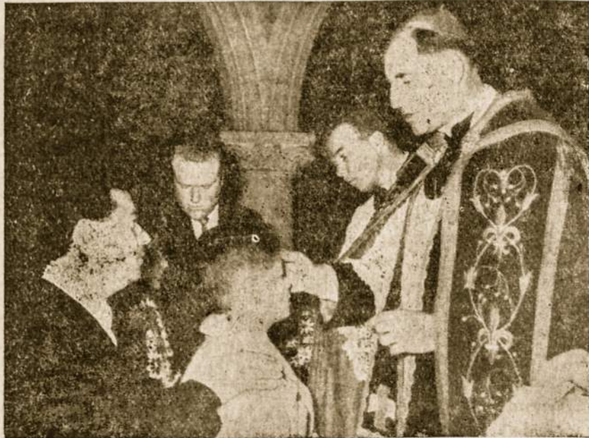
Sutvirtinimo Sakramentu krikščionis tampa aktyviu Bažnyčios apaštalu.

Esu Jūsų vyskupas, bet su jumis krikščionis. Pirmas reiškia patriga, antras malonę, vienas gaudėra, kitas ramina.