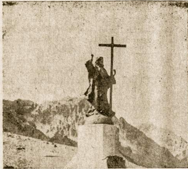
Kristus - pasaulio šviesa ir kelias, rodąs gaires paklydusiems.

nimas, kuris buvo išauklėtas tokioje aplinkoje: nebereikia klausyti tėvų ir mokytojų, nebereikia religijos, nei moralės. Vienintelis šūkis, kuris skamba jaunimo ausyse: reikia nuversti esamą tvarką, sugriauti "seną pasaulį" o ant jų griuvėsių pastatyti "naują pasaulį", kur niekas nevaržytų, kur laisvė "amžiais žydėtų".