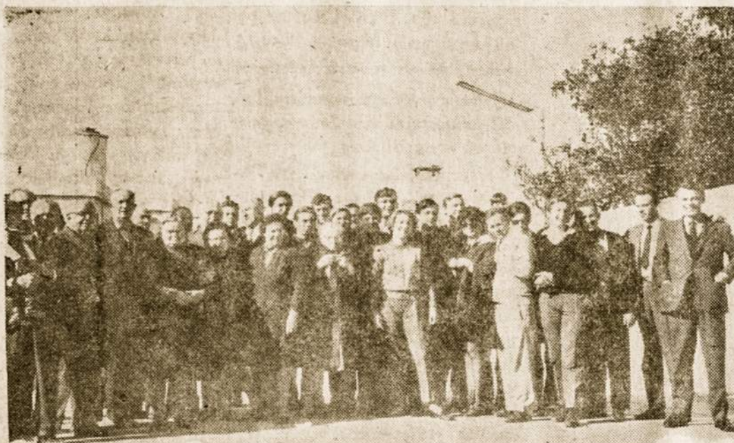
Veiklių Kordobos miesto lietuvių būrys drauge su svečiais iš Bs. Aires naujos bibliotekos atidarymo proga 1969 m. Šiais metais jie atidarė naują "Lituania" vardo gatvę (1970-8-16).

Buenos Aires atvykusius įvairių organizacijų atstovus, tautinių šokių ansamblį Rambyną ir kitus svečius, kurių atvyko virš 60 žmonių. Jiems visiems buvo parūpintos nakvynės pas Kordobos malonius lietuvius, kurie svečius gražiai vaišino ir globojo.