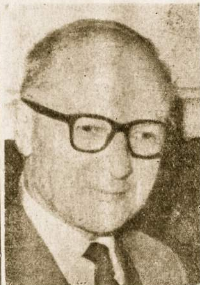
Buv. red. J. Mikalčius.

silankymu atneša ne tik naujienų, bet ir malonų džiaugsmą.