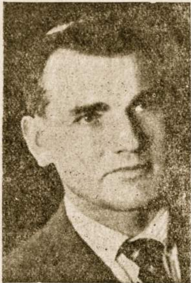
"Laiko" adm. - P. Gudelevičius.

Nuo tos dienos "Laikas" pasidarė labai daugelio lietuviškų šeimų draugas, kurio su nekantrumu yra laukiama atsilankant į namus, kaip laukiama gero draugo ar prieteliaus, kuris savo at-