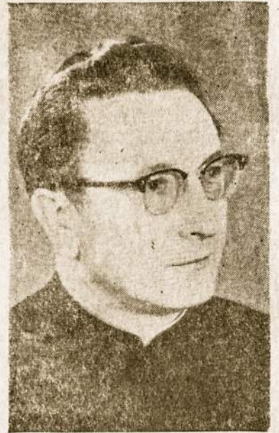
Buv. red. kun. G. Garšva.

mat, tol eis Laikas, nešdamas jums visiems padrąsinimo ir pa-