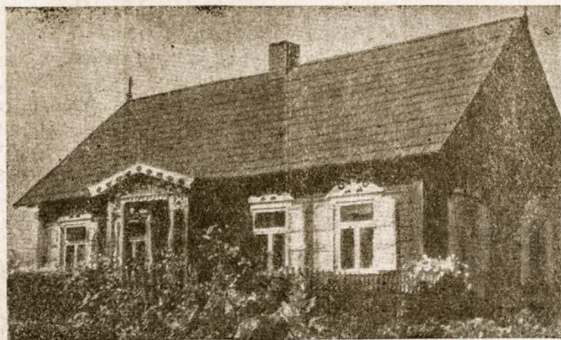
Tipinga lietuviška gričia. Tokiuose namuose gyvena Lietuvoje jūsų tėveliai ir mamytės prieš atvykstant į Argentiną.