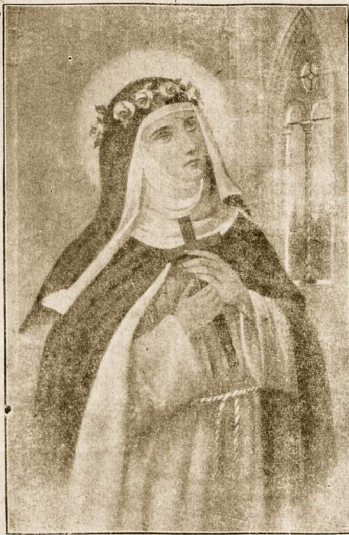
TERESA DE AVILA Šv. Rožė iš Limos

venimo realizmu: stovint su abiem kojomis ant žemės ir su abiem rankomis prisilaikant Dievo duoto mums tikėjimo ir moralės. Ne santvarka pakeis žmogų, bet žmogus gali pakeisti santvarką, jei jis tikrai gyvena pagal Dievo įstatymus.