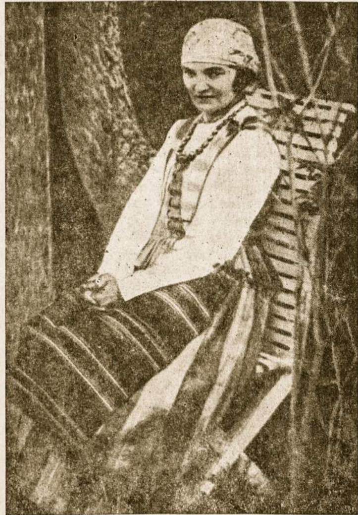
Rašytoja M. Pečkauskaitė - Satrijos Ragana.

Mokyti M. Pečkauskaitė pradėjo namuose. Šeima persikėlė į Užvenčio dvarą ir 1891 m. Pečkauskų vaikus pradėjo mokyti Povilas Višinskis, didelis lietuvis patriotas ir lietuviybės gaivintojas. Jis paveikė Pečkauskaitės tautinį apsisprendimą ir paskatino įsijungti į patriotinį sąjūdį, imtis plunksnos ir net davė jos pirmiems kūriniams kryptį. Pirmuosius jos raštus Višinskis spausdino Varpe, Ūkininke. Vė-