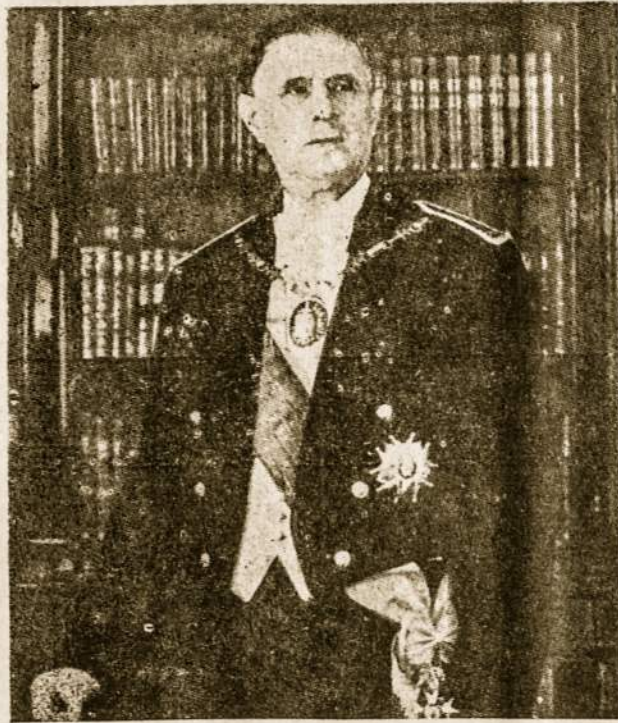
Buvęs Prancūzijos prezidentas ir laisvės kovotojas laike oficialaus vizito Argentinoje.

Laikė 1914 m. Didž. Karo, De Gaulle būdamas leitenantu dalyvavo keliuose mūšiuose jų tarpe garsiam Verdun mūšyje. Buvo keletą kartų sužeistas. Patekęs į vokiečių belaisvę. Po karo dalyvavo Lenkijoje kovose su komunistų daliniais vadovaujant generolui Weygand, kurie bandė užimti Lenkiją.