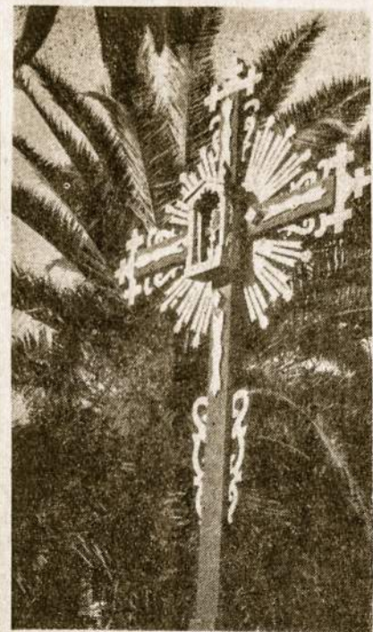
Lietuviškas kryžius parap. sodelyje, kur dažnai būna įvairių liet. organizacijų iškilmės.