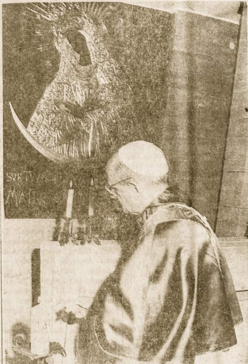
Sv. Tėvas Lietuvių Kankinių Koplyčioje Romoje laike jos šventinimo.

sideda nesutarimai, ginčai ir net karai, nes niekada nėra gana, kas turi daug, nori dar daugiau, atims iš to, kas mažiau turi. Nes žemiškos gėrybės žmones suskal-