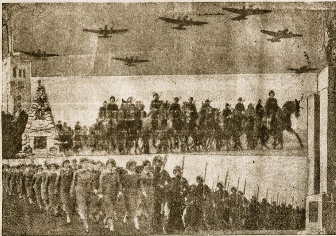
Vaidžiai iš Kariuomenės Šventės Lietuvoje (lapkričio 23 d.).