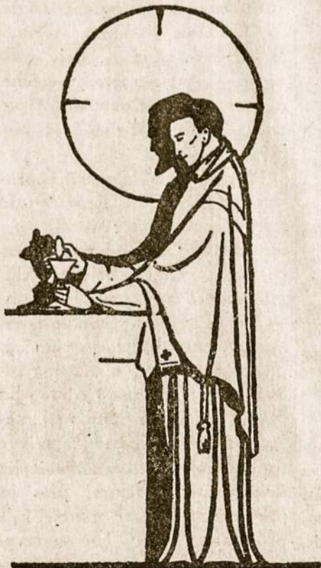
Bažnyčia turi pašventinti pasaulį — duoti pasauliui Dievą.