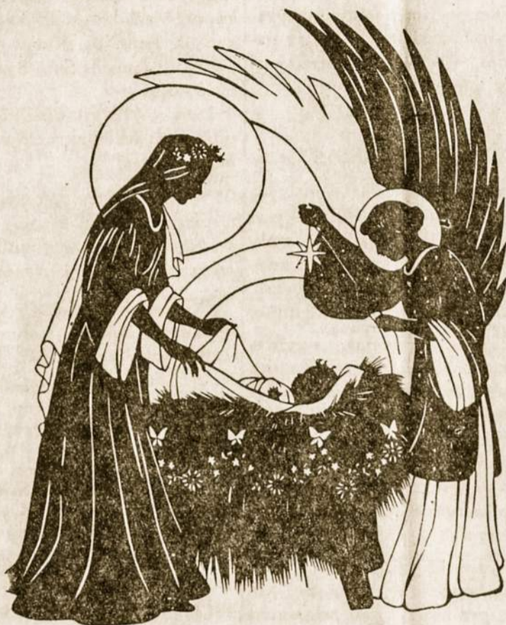
Garbė Dievui Anstybėse ir ramybė geros valios žmonėms žemėje!

Tat turime sugrįžti prie Bėteliaus piemenėlių paprastumo, kurie Kalėdų naktį atnešė jam