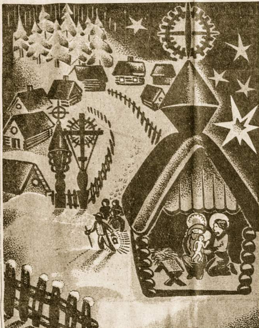
Kalėdų šventė tejungia mus visus!

• Nuo balandžio 1 d. Čekoslovakija pasunkino susisiekimą su vakarais. Kad padaryti galą "nepageidaujamiems politiniams ir ūkiniams rezultatams", iš Vak. Vokietijos, Austrijos atvykstantiems uždedami muitai 200 % prekių vertės. Išvežti leidžiama 5 dol. vienai savaitei. Išvažiuoti gali tik su atskiru leidimu, pristatčius artimų giminių iš užsienio kvietimą.