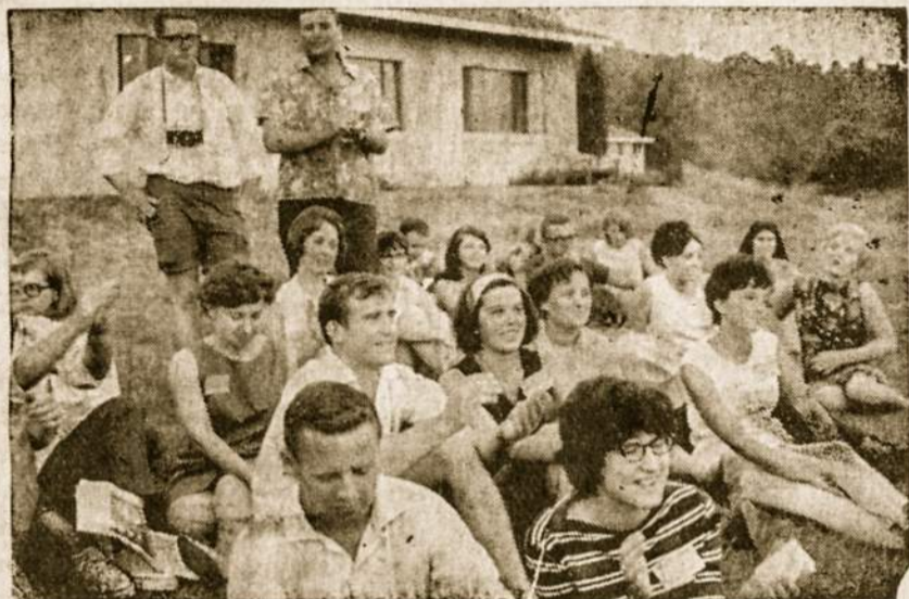
Vaidas iš I Pas. Liet. Jaunimo Kongreso stovyklos Dainavoje. Jame mūsų jaunimo buvo apie 20 atstovų.