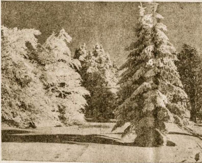
Baltuoju sniego tūbu pasipuošusi Lietuvos gamta laukia Šv. Kalėdų.