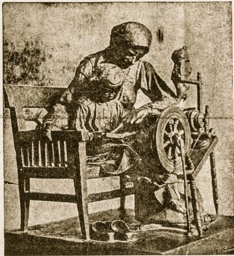
Mūsų bobutės žandarų persekiojamos mokė vaikus rašyti prie ratelio. Argentinoje yra laisvė motinoms mokinti vaikus lietuvių kalbą.

sioji Mergelė, kada jai buvo pranešta Dievo parodymas tapti motina. Ji atsakė: Štai aš Viešpaties tarnaitė. Kaž kas bandė šią mintį vystyti teigdamas, kad moters pareiga gyvenime esanti — būti tarnaite, būti apgailėtina, nuvargusia ir nuskriausta būtybe. Tačiau Marija kitaip tarnaitės sąvoką suprato — tai kilni, pasiaukojanti, norinti duoti, o ne imti kiekvienu atveju sutinkanti su Dievo valia, uoliai savo uždavinį pildanti moteris — motina.