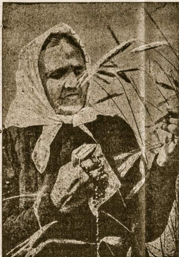
Lietuvė motina — gegužės mėn. visos liet. organizacijos daro jos pagerbimą. Sveikiname motinas Argentinoje ir Lietuvoje — mūsų pagarba ir meilė joms.

ma Švedija, kurios teritorijoje pasikeistų karo belaisviai. Niksonas matomai eina prie Vietnamo karo švelninimo politikos. Amerikoje yra varoma didelė akcija — kuo greičiau užbaigti Vietnamo