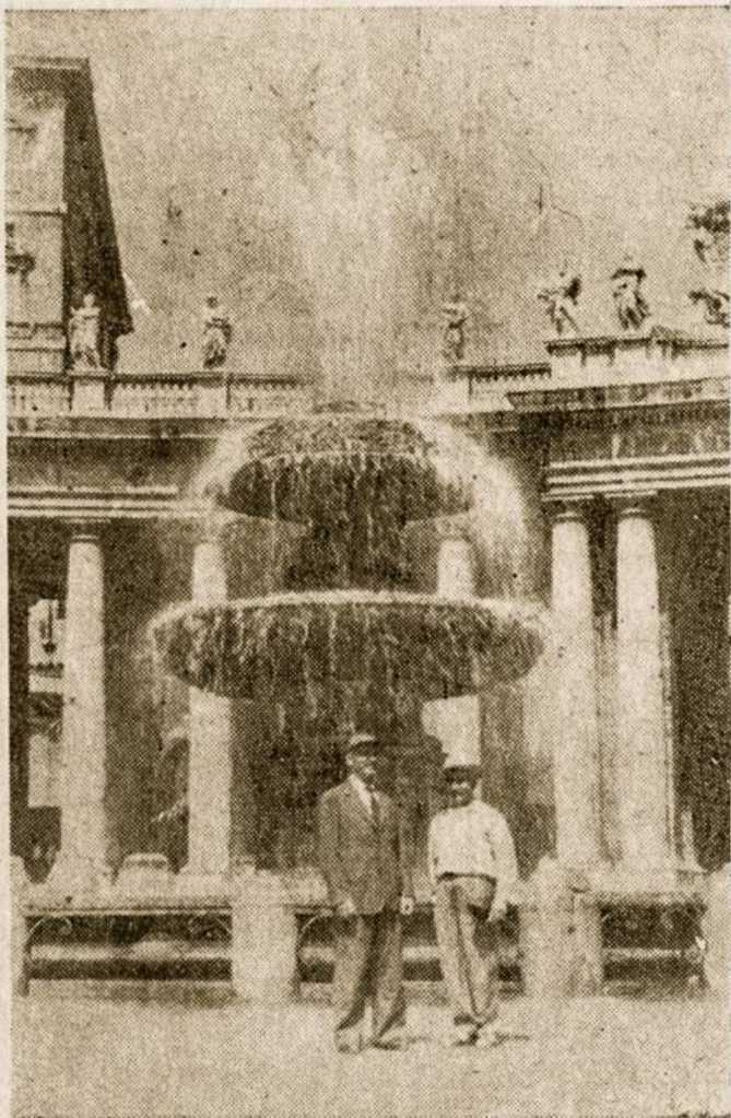
Krikščionybės centras yra Roma, iš kur ateina popiežiaus nurodymai.

Kyla klausimas, kokia yra tikra krikščionybė ir kokia tik dirbtinė, arba popierinė? Reikia tiksliai stebėti mūsų krikščionybės apraiškas, arba jos darbus, tuojau pastebėjus, kur tikroji ir kur netikroji krikščionybė.