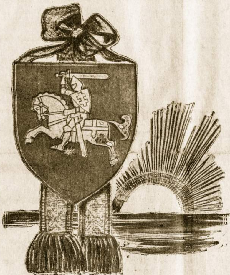
Lietuvos Nepriklausomybės kova vyksta toliau, iki bus laisva mūsų Lietuva.

Dėl to 1970 metai ir ypač paskutiniai trys mėnesiai buvo ypatingai svarbūs aplamai ir reikšmingi Lietuvos laisvinimo bylai.