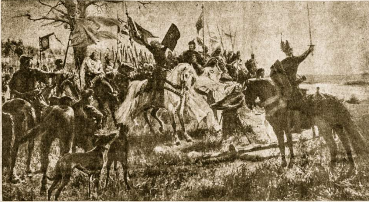
15-16 amžiaus Lietuvos Kariuomenė: Vytautas prisiekia atgauti prarastas žemes ir plėsti Lietuvos teritoriją.

Šiais metais sukanka 53 metai nuo Lietuvos nepriklausomybės atstatymo ir 31 nuo antro jo praradimo.