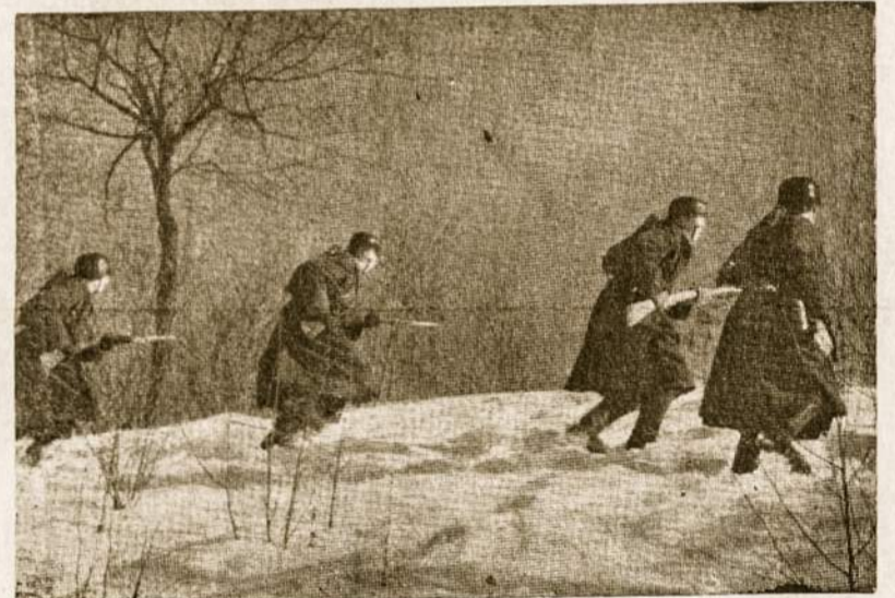
20 amž. Lietuvos kariuomenės savanoriai — savo auka ir krauju užtikrina nepriklausomybę.

Su šita viltimi atstatyti vėl Lietuvos valstybę gyvena ne tik pavergtieji broliai, bet ir visi są-