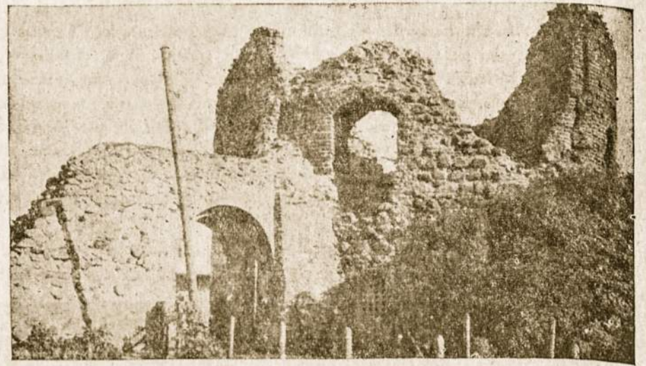
Kauno pilies griuvėsiai — mūsų praeities liudininkai.

Po 1795 m. Lietuvos — Lenkijos padalinimo Kaunas priklausė rusams, o kairioji Nemuno pusė priskirta Prūsijai, t. y. Kaunas tapo padalintas. Kaunas ne-