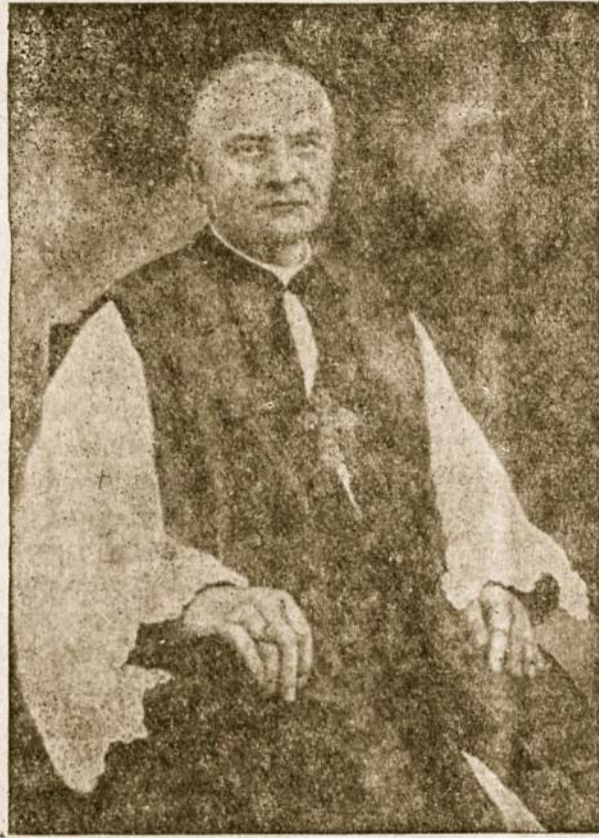
Arkivyskupas Jurgis Matulaitis. Jo beatifikacijos byla jau pradėta š. m. sausio 18 d. Romoje.

Septyni metai Vilniuje ganytojo pareigose buvo tikra kančia, kuri išryškino jo išmintį, teisingumą, išvermę, kantrybę, drąsą, uolumą ir ypač meilę, su tuo jis