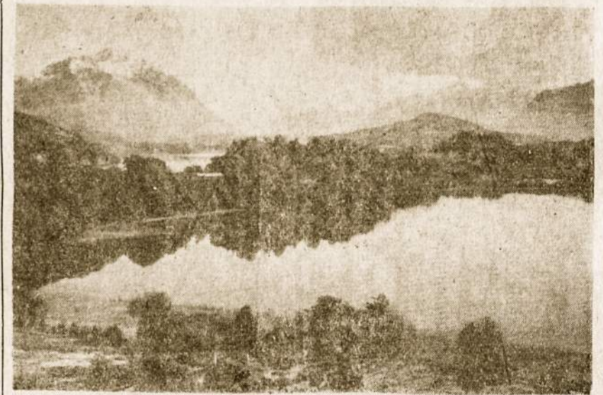
Argentinios Šveicarija — gražus San Carlos de Bariloche vaizdas. Ten taip pat gyvena lietuviai.

Geras žodis įstringa į širdį ir tam tikru laiku atneša vaisių.