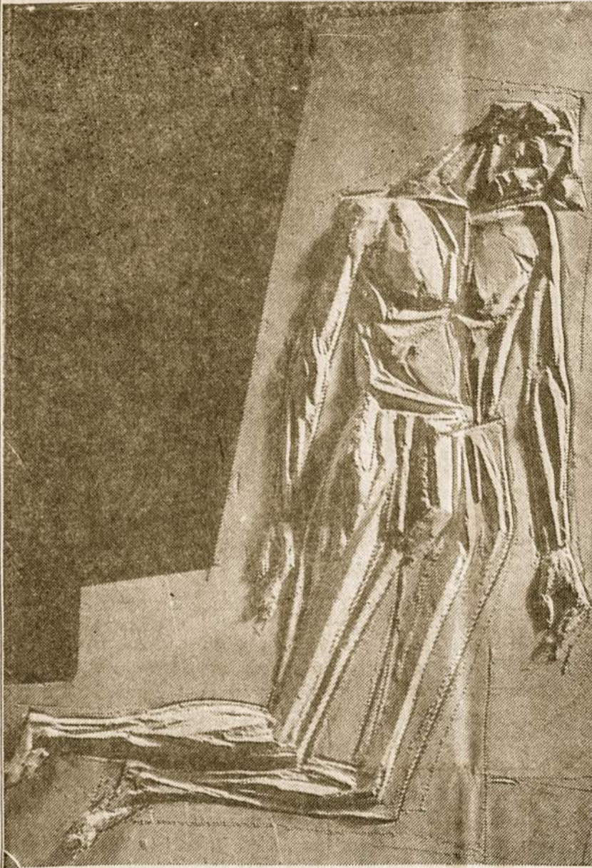
Kenčiančios Bažnyčios Lietuvoje Simbolis Lietuvos Kankinių Koplyčioje Romoje.