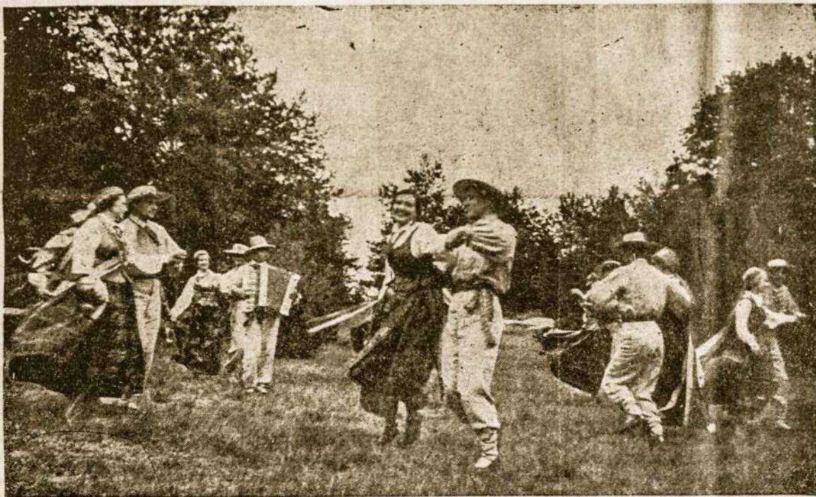
Jaunimo gegužinė Lietuvos miške. Mūsų jaunimas turi daugiau susiorganizuoti ir pradėti veikti, nes artinasi II P. Liet. Jaunimo Kongresas.