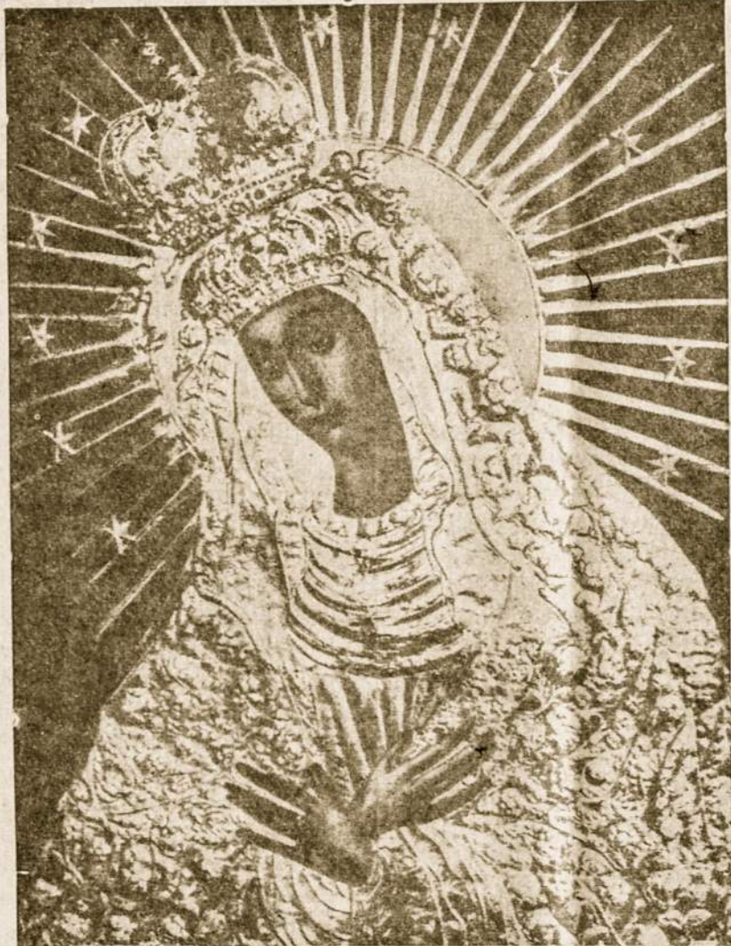
Aušros Vartų Vilniuje Marija. Visa lietuvių tauta su pagarba ir meile yra atsidavusi savo globėjai Dievo, Motinai.

į rarių-ankstybasias mišias prie Marijos altoriaus. Kiekvieną sekmadienį vos tik atsidarius durims,