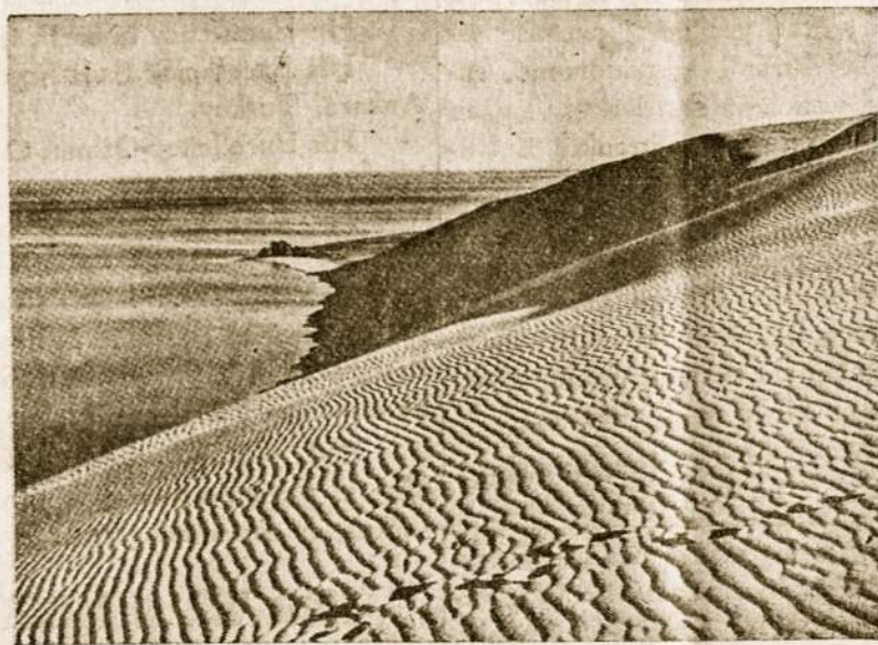
Gražiosios geltono smėlio kopos Baltijos jūros pakrakštyje, Nidoje (Neringa).

Lietuvių kalbos tarmių chrestomatija, plačios apimties veikalą, yra paruošę spaudai okup. Lietuvos lituanistai.