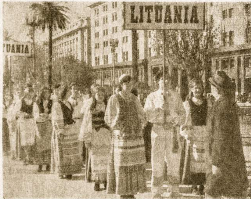
SLA ir "Atžalyno" jaunimas žygiuoja Bs. Aires gatvėmis 25.V.71.

Po to per garsiakalbius buvo pranešta, kad užsienio grupės parados Rivadavijos gatve. Ir vėl ilga virtinė įvairiaspalvių kostiumų pradėjo eiti nuo Plaza de Mayo iki Pl. Congreso. Žmonės, jų buvo pilni gatvės pakraščiai, laukė pasirodant užsienio grupių ir juos sutiko su dideliu džiangsmu, plojimais ir šauksmais. Lietuviams pasirodžius, girdėjosi šūkiai: "Viva Lituania!", "Viva Lituania libre!", "Los países bálticos — Lituania, Letonia Estonia