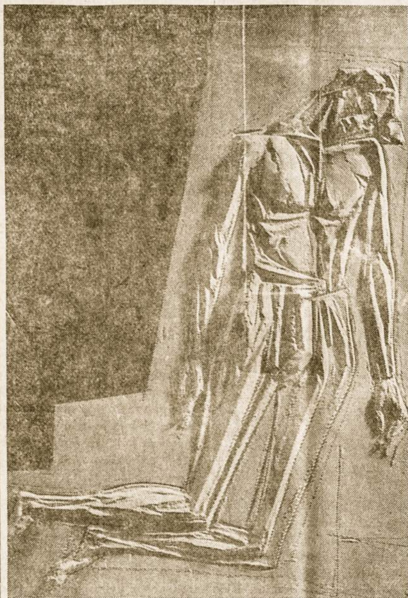
Krito už laisvę. Lietuvos sukilimo 30 metų minėjimas ir žuvusiųjų pagerbimas įvyks sekmadienį, birželio 20 d. 17 val. lietuvių parapijos patalpose. Kviečiame visus lietuvius patriotus dalyvauti šiame minėjime.

• 1971 m. okup. Lietuvoje pradėjo veikti naujas įstatymas žvejotojams. Jie galės švejoti tik savo būriui priklausančiame vandens plote.