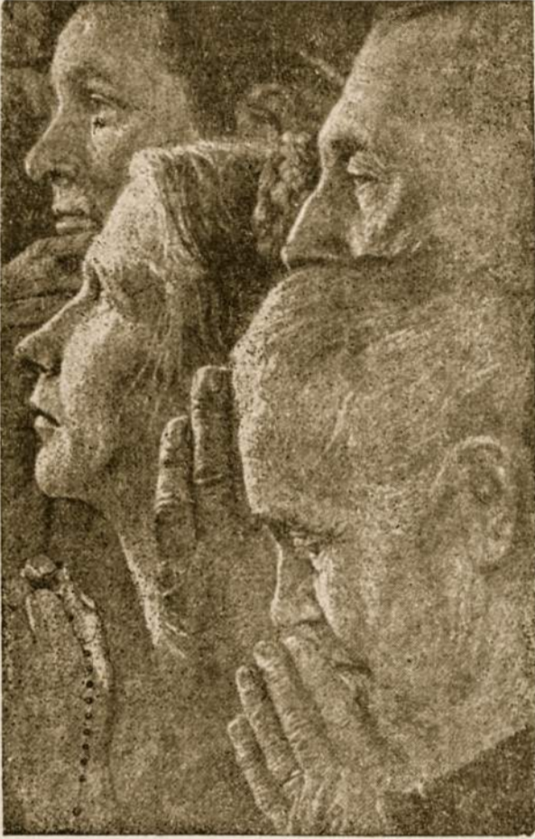
Bendra malda. Katalikų Bažnyčia siekia krikščionių sujungimo.

krikščionių vienybės klausimus. Paskutiniame krikščionių suvažiavime 1969 metais Ženevoje dalyvavo pats popiežius Povilas VI, kuris visų krikščionių atstovų buvo labai nuosirdžiai priimtas. Ta proga Šv. Tėvas išreiškė savo patitenkinimą, kad krikščionys vienijasi ir kartu veikia. NAUJAIS POSUKIS BAŽNYČIOJE Nauja vienybės banga atėjo per Vatikano II suvažiavimą