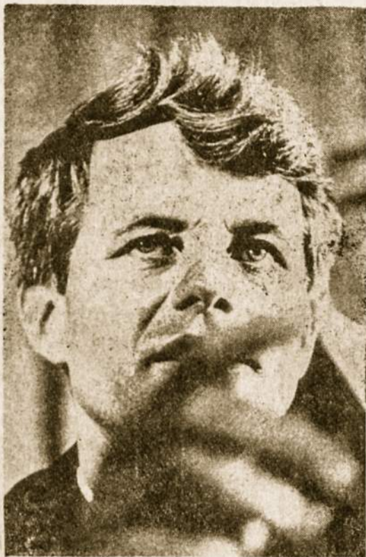
Robert Kennedy kovojęs ir žuvęs dėl žmonijos gerovės.