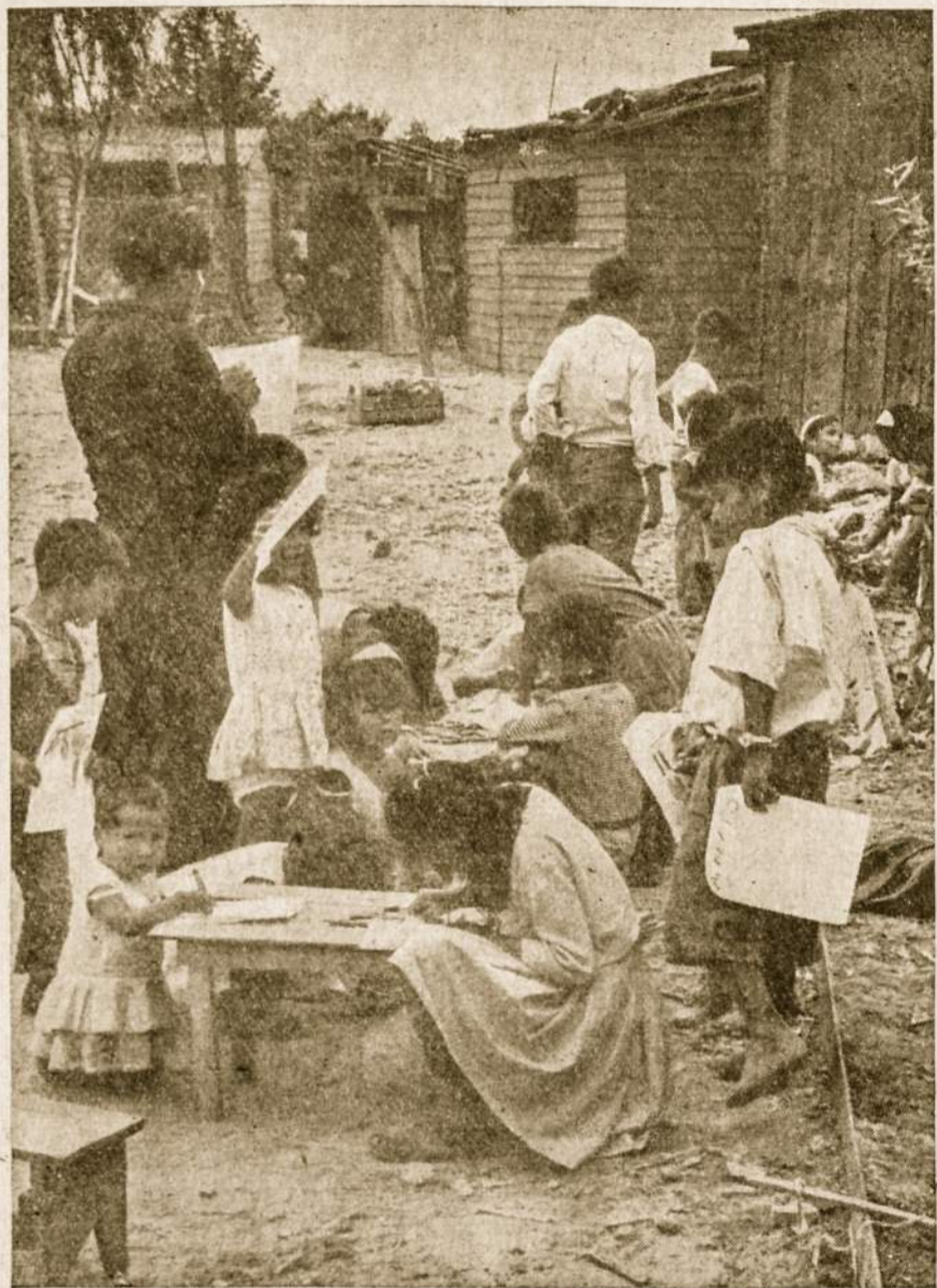
Pabėgėlių sunkus gyvenimas priverčia mus susimąstyti ir ateiti jiems pagalbom.

Nes nei "stikliukas", nei žmonių žodžiai negali duoti galutinio atsakymo į kaikiuriuos klausimus, kai žmogus atsiranda kryžkelėje, arba krizėje, kai jis prieina liepto galą. Tik vienas Dievas, kuris žino visus paslėptus dalykus, ku-