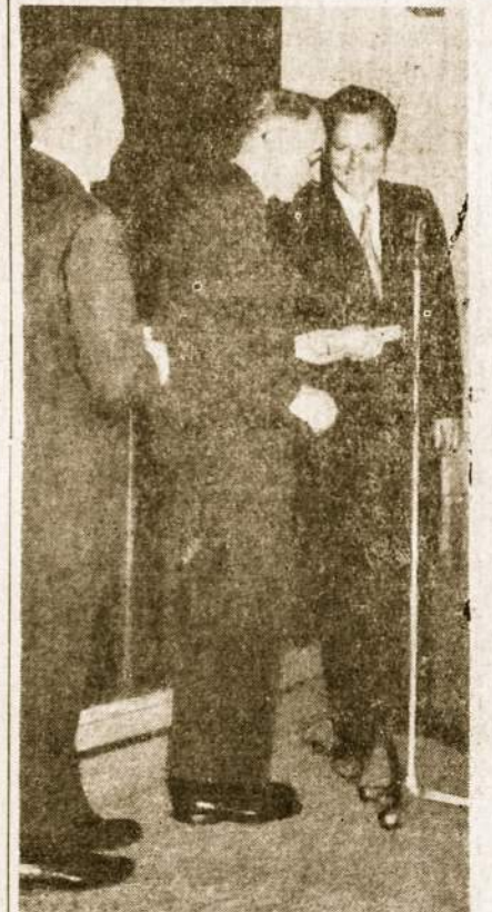
ALOS Tarybos sveikinimas — pergaminas įteikimas Laiko redaktoriui.

Didysis spaudos uždavinys tai ir būtų: apjungti lietuvius ir išlaikyti vienybę ir tautinę sąmonę, nes kartojant į Lietuvos sidabrinį