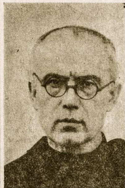
Tėvas M. Kolbe.

Tėvas Kolbe suprato, kad nėra ko laiko veltui leisti, reikia veikti, kol dar nevēlu. Todėl jis įsteigė Nekalto Prasiidėjimo miestą, kuriame veikė spaustuve. Šiame Nek. Prasiidėjimo mieste bu-