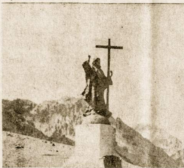
Kristus tarp Argentinos ir Čilės — taikos simbolis.

Tiktai Kristaus Evangelija, pasėta į žmonių širdis, galės savu laiku atnešti vaisių. Iš tikrųjų Kristaus Evangelija turėtų būti