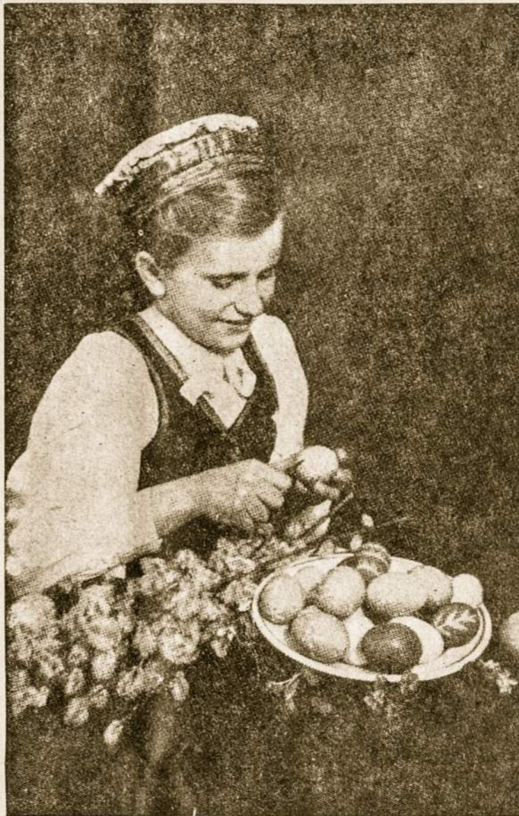
Malonus Velykų švenčių pasiruošimas.

• Simo Kudirko vardo stipendijų fondas įsteigtas Š. Amerikoje 1971 m. Fondas skiria stipendiją asmeniui, pasiryžusiam studijuoti Freedom Study Centre, kad susipažintų ir rastų priemonių kaip laisvą pasaulį įspėti ir apsaugoti nuo komunistų vykdomo laisvų tautų naikavimo bei žmogaus laisvės paneigimo. Fondo tikslas taip pat yra neleisti užmiršimo dulkėmis apkloti Simo Kudirkos ir mūsų tautos tragedijų.