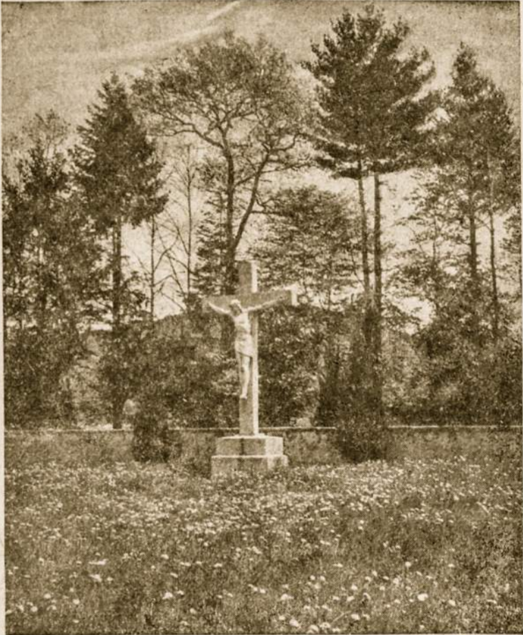
Kristus ant Kryžiaus atnešė išganymą ir davė atsakymą paklydusiems žmonijai.

Kurie tyrinėja gamtos paslaptis, mes tuos vadiname mokslininkais, kurie studijuoja žmogaus vidų, tuos vadiname psichologais, psichiatrais ar kitai stitulis.