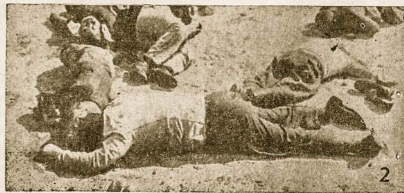
Komunistinio teroro aukos 1941 metais.

Taip senas tėvas buvo priversas išvežti iš namų savo raudančią dukterį su penkais anūkėliais į Zara-