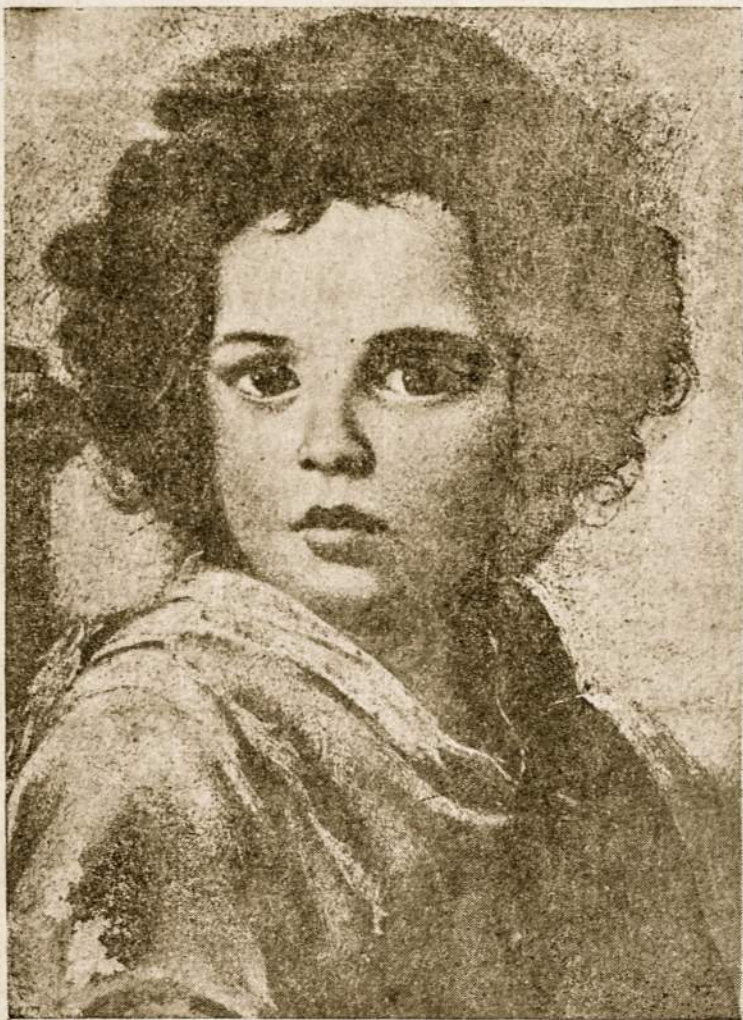
Vaikelis — Jėzus atnešė mums išganymą.

Panašią legendą jau turėjo senovės graikai, kur kalbama apie Promėtiejų, kuris norėjęs iš dievų pavogti ugnį ir atnešti į