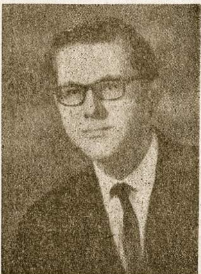
Pianistas Vytautas Puškorius.