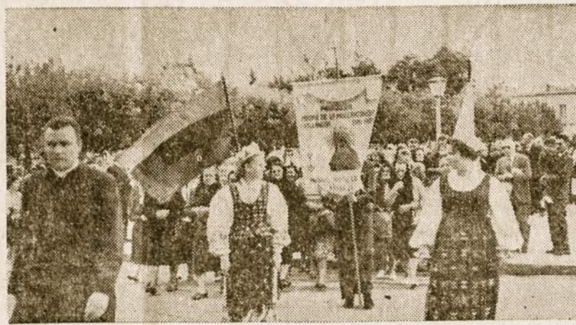
Lietuvių Jaunimas Lujano šventovėje. Jaunimas turi entuziazmo, veikia, tik trūksta vadų.

Todėl nenuostabu, kad ir mūsų jaunimas, kuris gyvena šiame minčių sukūryje, yra gundomas ar į vieną ar į kitą pusę. Žinome, kad pasiturinčių lietuviškų šeimų dalis jaunimo nueina ar tai su "hipiais" užsiaugindami sau barzdas ir ilgus plaukus, arba net su revoliucionieriais.