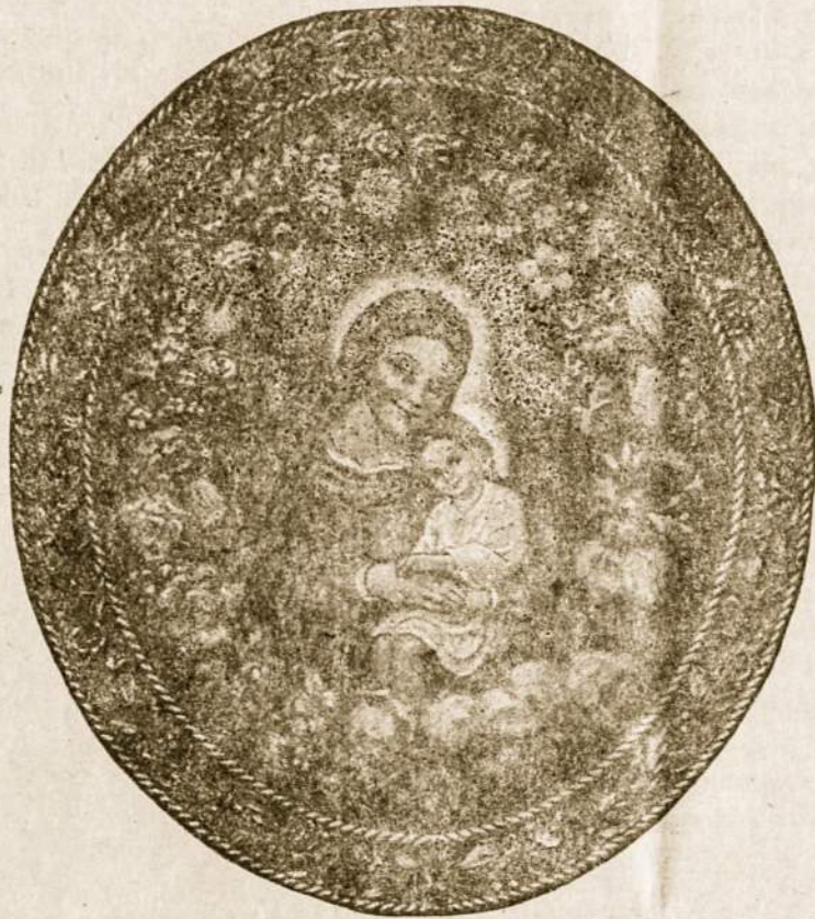
Lietuvių labai mylima Pažaislio vienuolyno Dievo Motina.

Šį spalio mėnesį, kuriame minime Rožančiaus Karalienės šventę, būtų gražu, kad mes lietuviai prisimintume Marijos galingą užtarymą mūsų tautai, kad prašytume jos pagalbos sunkiuose šių dienų žmonijos sukuriuose.