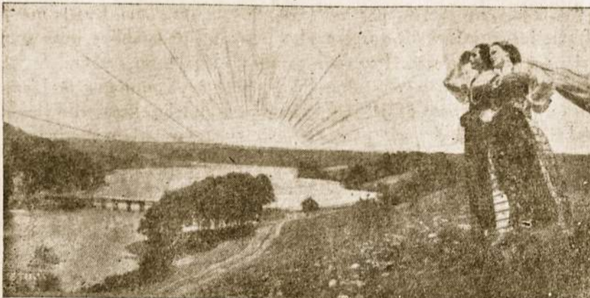
Prie Dubingio ežero — vaizdas iš lietuviškų filmų.

"A. L. Balsas" ir jo bendradarbiai gyvena sava aritmetika. Pagal juos, girk Sovietų Sąjungą ir jos primetą valdžią okupuotame krašte — būsi geras žmogus. Didžiukis istorine Lietuva, kalbėk apie lietuvių tautos didvyrius — jau nebūsi toks geras žmogus. Kalbėk apie žudymus, deportacijas ar terorą — būsi blogas žmogus. Paklausk, kodėl Lietuva po tiek metų yra pasaulio turistui (ir patiems lietuviams) uždarytas kraštas — būsi blogas žmogus. Kalbėk apie septyniolikos tūkstančių lietuvių katalikų skundą Jungt. Tautoms prieš religijos persekiojimą — būsi blogas žmogus. Nori būti geras žmogus, nori būti "A. L. Balso"