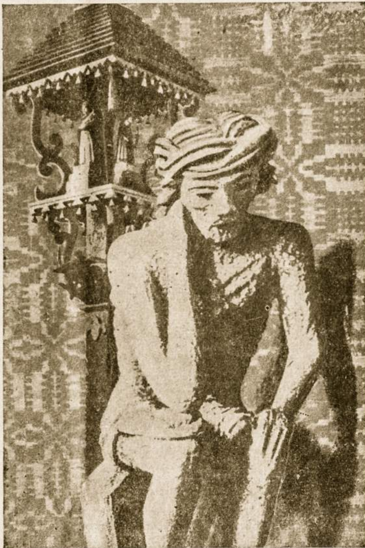
Kristus per kančią ir kryžių mus atpirko. Jis kviečia ir mus dalyvauti jo kančioje.