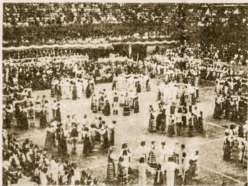
Vaidas iš šokių šventės Čikagoje — dalyvavusieji mūsų delegatai joje buvo sužavėti jos didingumu iki ašarų.

Yra ir kitų priežasčių, kodėl ne visi jaunuoliai įsijungia į lietuvišką veikimą. Didžiausioji išsivijos liga — nutautėjimas, negailestingai graužia lietuviškos šaknis. Esama ir tėvų apsilaidimas. Kaip taisyklė, tėvų apsilaidimas reiškia vaikų apsilaidimą. Jeigu tėvams rūpi tikrai ieškoti geresnio gyvenimo: ar turto, ar garbės, ar vedybų svetimtaučių tarpe, ar įtakingesnių draugų,