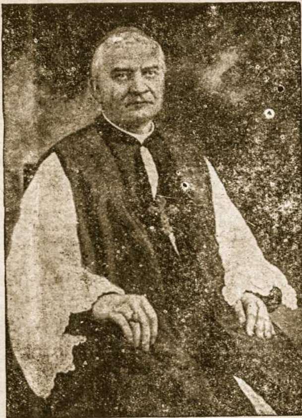
Dievo Tarnas arkiv. Jurgis Matulaitis miręs 1927 m. sausio mėn. 27 d. Jo beatifikacijos byla eina pirmyn.

Tačiau yra kitų didvyrių, apie kuriuos mažai kas kalba ir rašo, tai pilko gyvenimo didvyriai, pasiaukoję dėl kitų labo, kaip pavyzdžiui; mūsų savanoriai, mūsų tautos kūrėjai, misijonieriai ir kiti.