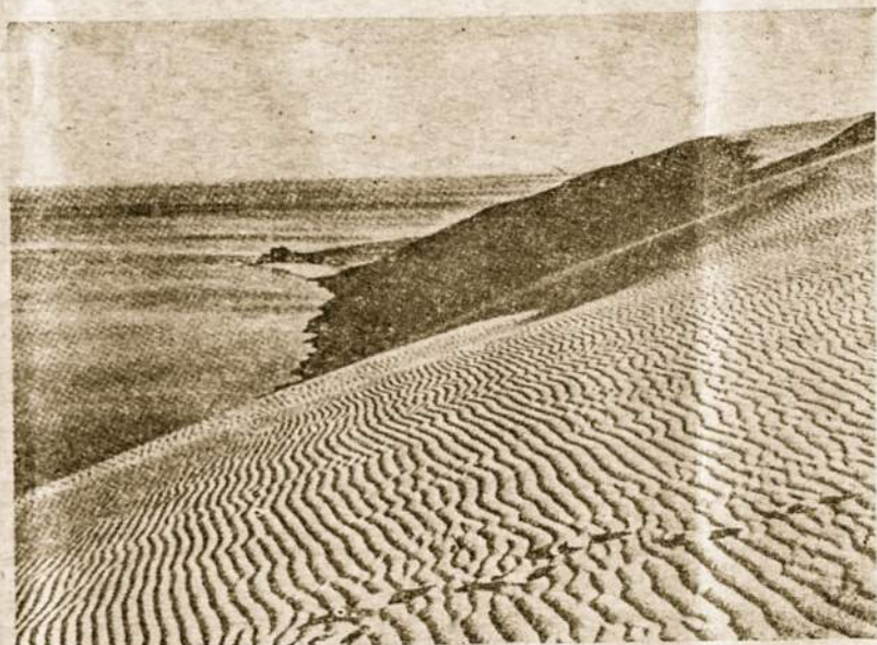
Žavingas Klaipėdos krašto vaizdas — smėlio kopos prie Nidos.

Klaipėdos pilis buvo svarbi strateginė vieta lietuviams, nes iš čia jie lengvai galėjo pulti vokiečių ordenus, gi abiem ordeno šakom trugdė susijungimą (dabartinės Prūsijos ir Latvijos žemės). Visą laiką ordenas stengėsi prištartinti prie Klaipėdos pilies ir pastatyti savo sutvirtinimus. Tačiau priešui lizdai tuojaus buvo žemaičių sunaikinami. Tik 1252 m. jiems pavyko pastatyti ažuolų, akmenų ir plytų stiprią kelturkampe pilį tarp Kuršių marių ir Dangės įtako. Lietuviai nuolat stengėsi sunaikinti ją. Jiems kartais pavykdavo ją dalimi išgriauti, bet ordenas gaudamas pagalbą iš Vakarų, ją tuojaus atstatydavo. Lietuvos valdovai Mindaugas , Gediminas , Algirdas , Kęstutis ir Vytautas kovojo su ordenu už Klaipėdos pilį ir kraštą. Šių kovų zenitas buvo didysis Žalgirio mūšis (1410 m.) sustabdęs galutinai Ordeno veržimąsi į rytus. Sekė Torunės taika. Joje Vytautas reikalavo sau tarp kitko ir Klaipėdos pilies ir teritorijos. Atmintini Vytauto žodžiai: "Prūsai yra taip pat mano protėvių žemė ir aš jos reikalausiu iki pat Uosos; nes ji yra mano tėvų palikimas". Tačiau sekančiose derybose (1422 m.) Klaipėda atiteko Ordenui, gi Vytautas gavo Žemaičius ir priėjimą prie Jūros ties Palanga Ordenui išnykus, Klaipėdos kraštas atiteko Brandenburgo Hohencolernams , kurie jį valdė iki 1918 m.