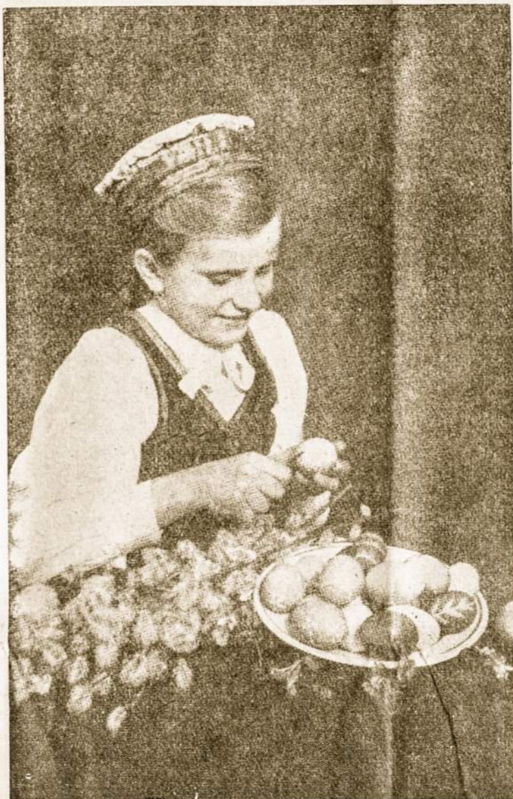
Velykų džiaugsmas — margučių paruošimas.

Giesmės žodžiais žmonės guodėsi ir raminosi. Dažnas nesuprasdavo, ko jam visu kūnu ei-