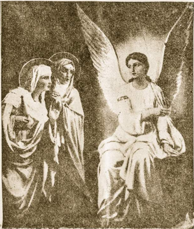
„... Jūs ieškote Jėzaus Nazarėno, kuris buvo prikaltas prie Kryžiaus; jis prisikėlė, jo nėra čia“...

Velykos buvo visų laukiamos ir tai šventei buvo su visu stropumu ruošiamasi per visą gėvėnios metą: pasninkaujant, apmąstant Kristaus kančią, apvaikščiojant Kryžiaus kelius ir giedant graudžius verksmus. Didžioji Savaitė pradėdant su Verbomis buvo kažkas nepaprasto ir švento bei didingo: bažnyčios prisipildydavo