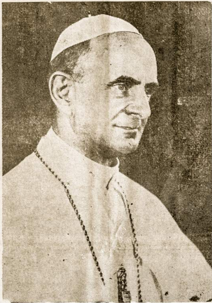
Sv. Tėvas Povilas VI, kuriam šį mėnesį sukanka 10 metų nuo jo išrinkimo popiežiumi.

Šie jubiliejiniai metai, kuriuos skelbia Povilas VI skiriasi nuo kitų jubiliejinių metų, kad jie pritaikomi visoms bažnyčioms, ypač vyskupijų katedroms, kurias lankant galima laimėti visuotinus atlaides.