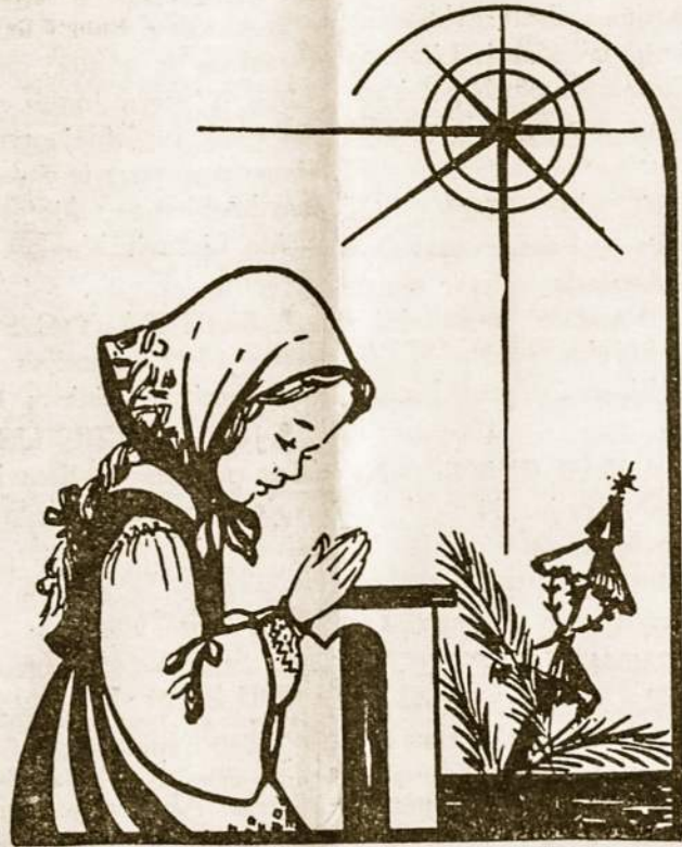
Mūsų malda tebūnie labai paprasta, nuoširdi ir kūdikiška.

Vienas jūnas šeimos tėvas papasakojo savo gyvenimo kaiku-kuriuos momentus ir paaiškino, kad “Tėve Mūsų” malda jam tapo gyvenimo programa, pagal kurią jis gyvena. Tat, bandysime per šias eilutes “Tėve Mūsų” malda pritaikinti prie mūsų gyvenimo.