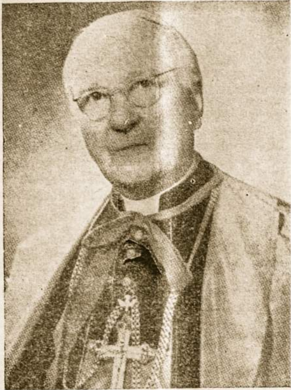
Pirmas nepriklausomos Lietuvos arkivyskupas Juozapas Skvireckas Šv. Rašto vertėjas ir leidėjas.

Šie 1973 metai atneša visą eilę šimto metų gimimo sukakčių, kurias verta atžymėti ir pagal galimybes paminėti.