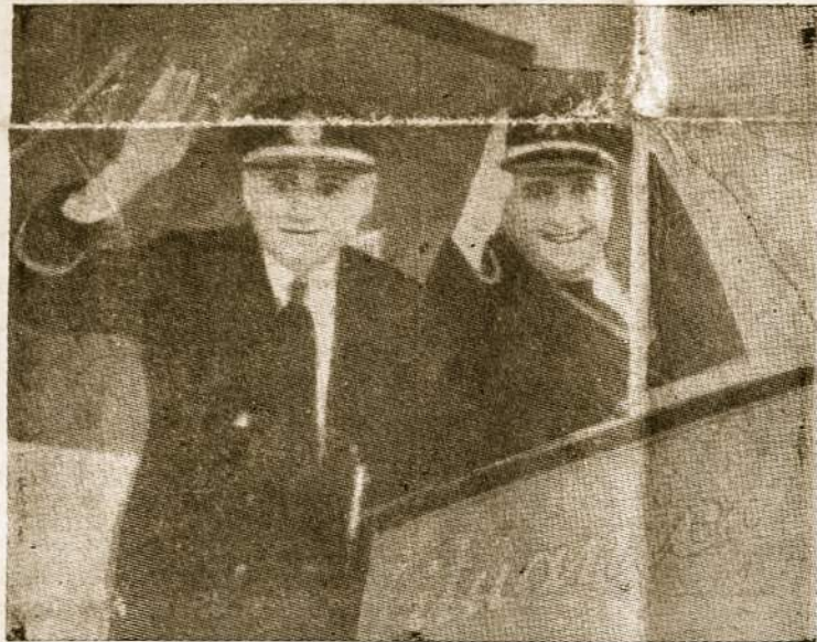
Šiais metais švenčiam 40 metų Dariaus ir Girėno garbingo žygio sukaktį. Minėjimo metu programoje dalyvaus svečiai iš Brazilijos.