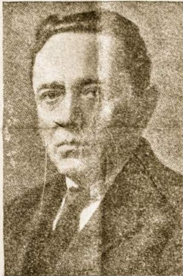
Poetas Jurgis Baltrušaitis, Lietuvos diplomatas, miręs Paryžiuje.

Jurgis Baltrušaitis gimė 1873 m. kovo 20 Paantvardžiuose, Skirsnemunės valsčiuje. Mirė Paryžiuje 1944 sausio 3. Žy-