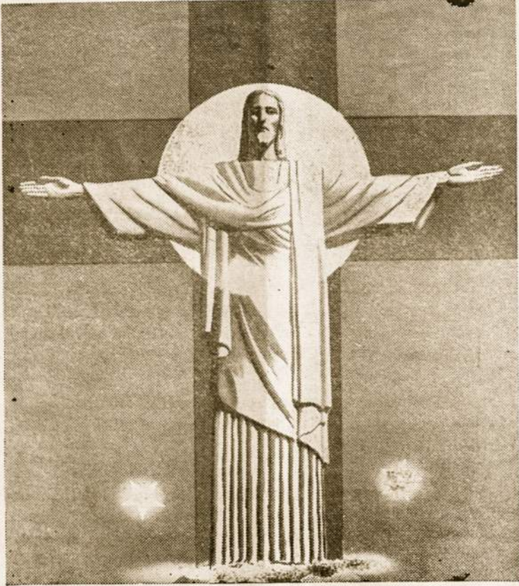
Kristus — Vyriausias Kunigas atėjo į žemę pašventinti žmoniją.

Turėjo pats Dievas pašventinti žmones, nes jis yra visokio šventumo šaltinis, kuris pagal savo šventumo paveikslą buvo su-