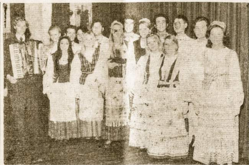
“Ateities” ansamblis gražiai pasirodė Dariaus ir Girėno minėjime. Jie aktyviai draugavo su svečiais iš Brazilijos.

Vakaro aprašymuose įkyriai pabrėžiamas lietuvių tautos “amžinas dėkingumas” rusams. Žodis “tėvynė” tevertojamas Rusijos atžvilgiu. “Mūsų neaprepiamos Tėvynės sostinėje Maskvoje skamba Tarybų Lietuvos žodžio meistrų eilės” — taip rašoma Lietuvos KP CK pareiškime