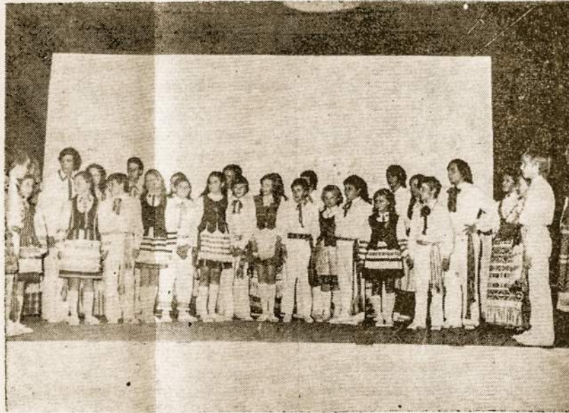
Susivienijimo Lietuvių Argentinoje ansamblis pasirodęs minėjime su puikia programa.