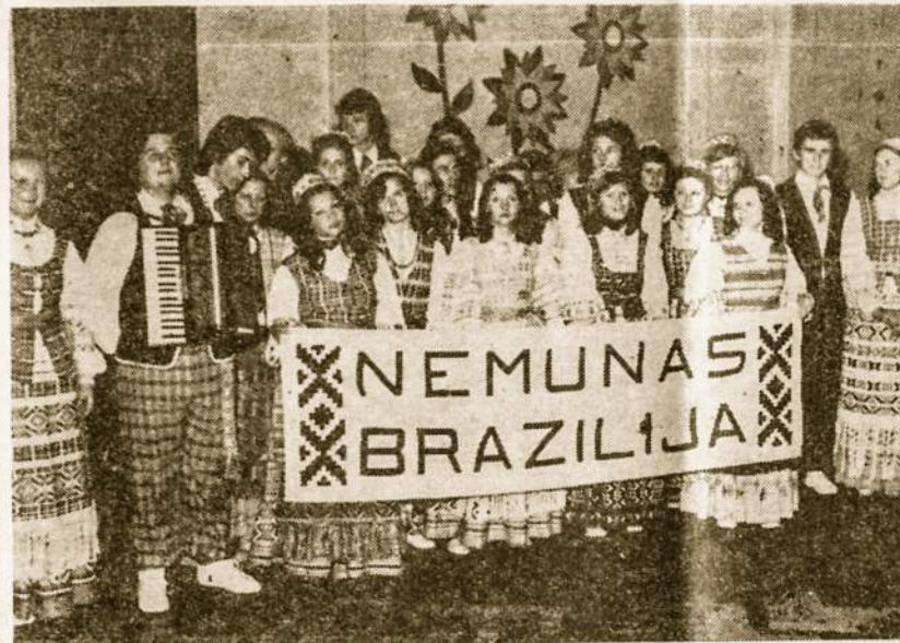
“Nemuno” ansamblis iš Brazilijos, San Paulo miesto. Savo viešnagės metu, jie keletą kartų pasirodė su tautiniais šokiais, artimai susipažino su Argentinos lietuvių jaunimu.

Liepos 25 d. Paskutinė viešnagės diena. Apie vidurdienį Brazilijos ir Argentinos jaunimas lietuvių parapijos aikštelėje turėjo sportinį susitikimą, laimėjo argentiniečiai. Po to vakare svečiai buvo vėl tuo pačiu autobusu nugabenti į Boca, kur įvyko jų atsisveikinimas restorane “Spadavecchia”. Vakariene ir bendri šokiai dalyvavo 87 asmenys. Šokta ir linksmintasi iki pat ryto.