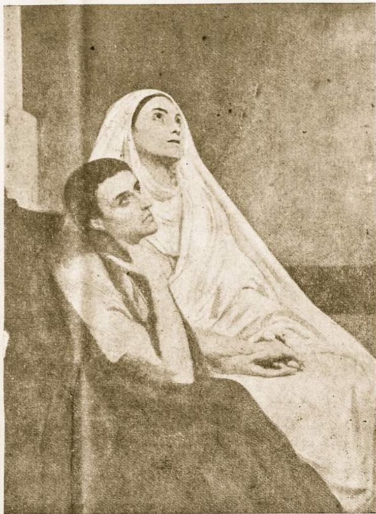
Šv. Augustinas su motina — Monika.