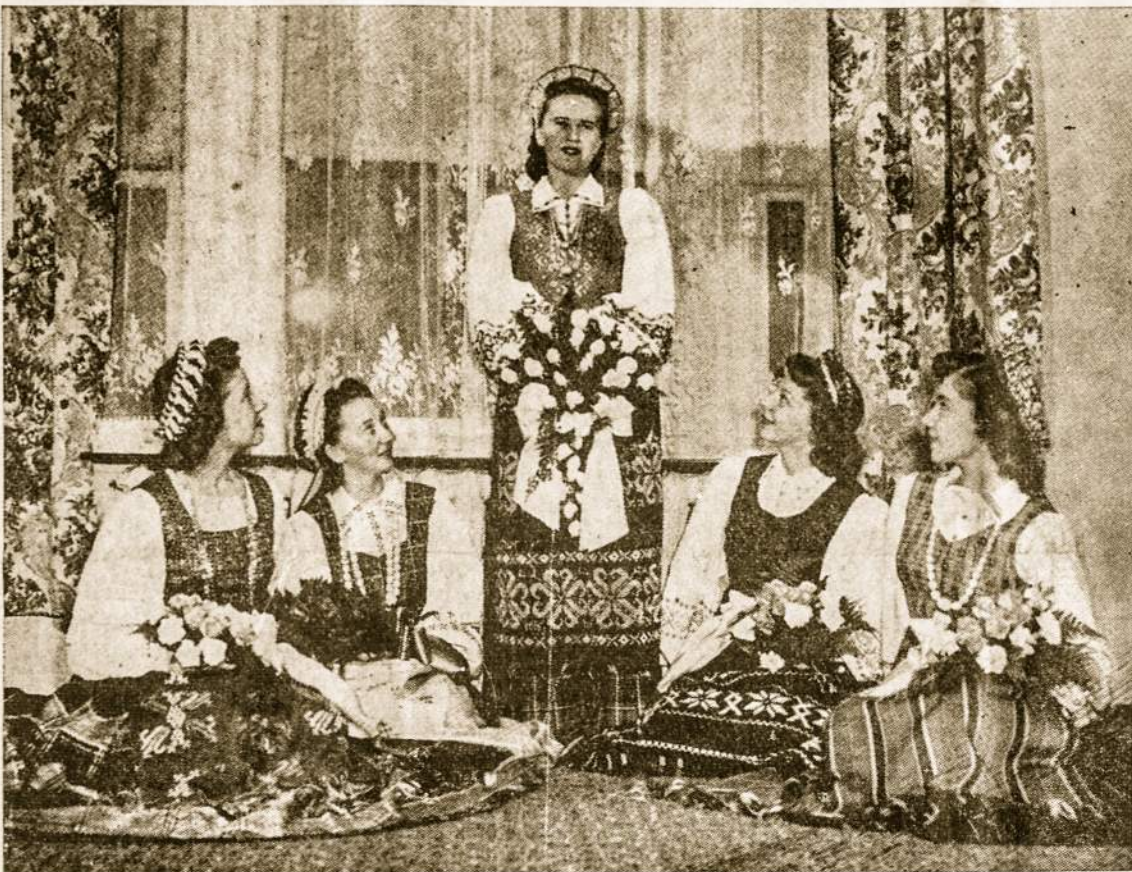
Lietuviškos vestuvės - nuotaka ir jos pamergės apsirengusios puikiais lietuviškais rūbais. Tas gražus paprotys vyravo nepriklausomai Lietuvos laikais, praktikuoja jį dažnai Amerikos ir Kanados lietuviai.