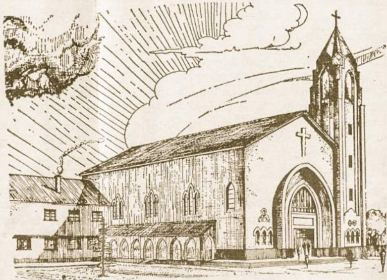
Rosario Šv. Kazimiero bažnyčia. Pastatyta ir administruojama lietuvių kunigų marijonų.

• Įvairių vaistinių augalų okupuota Lietuvoje kasmet superkama 300-400 tonų. Dažniausiai juos į supirkimo punktus pristato apylinkės gyventojai ir mokiniai.