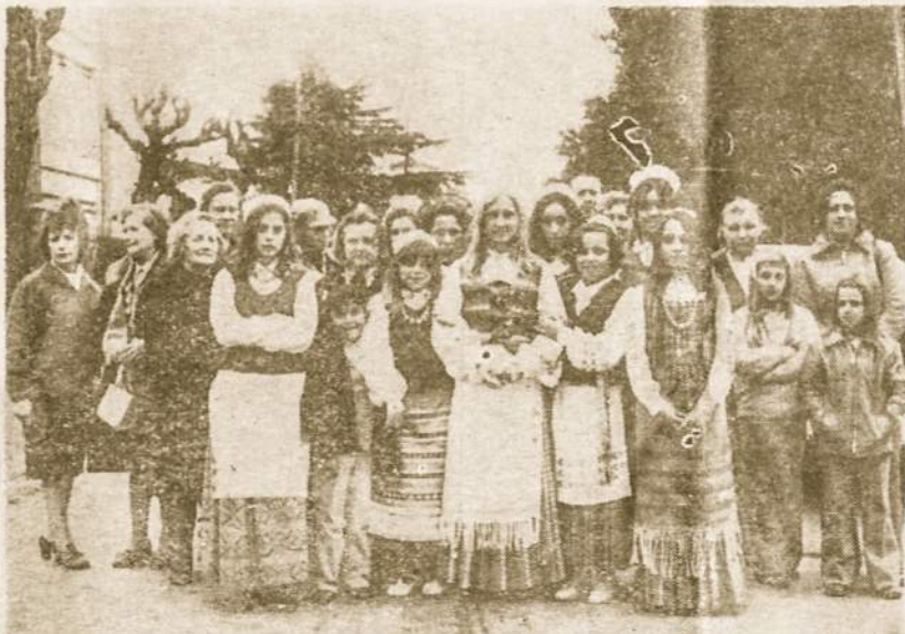
Birutietės ir jaunosios birutietės laike vienos savo šventės. Birutės draugijos metinė šventė įvyks gruodžio 9 d. 12 val., c. Jorge 330, Adroge.