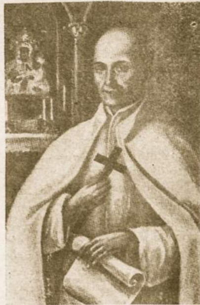
Marijonų vienuolijos įsteigėjas, Dievo Tarnas kun. St. M. Papczynskis.

Siemet sueina 300 metų nuo Marijonų Vienuolijos įkūrimo. Šiame rašinyje tik labai bendrais bruožais mėginu peržvelgti šios vienuolijos istoriją nuo jos pradžios iki mūsų dienų.