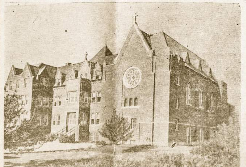
Marijonų kunigų seminarija Š. Amerikoje, Marian Hills, Illinois.

• Toronte, Kanadoje, į "Paramos" lietuvių banką įsiveržė piktadariai, grąšindami tarnautojams su ilgais peiliais, iš stalčių išnešė kelis tūkstančius dolerių.