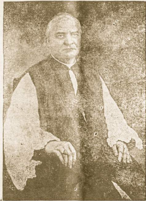
Jurgis Matulaitis, marijonų vienuolijos atnaujintojas Lietuvoje. Jo šventuoju paskelbimo byla užvesta Vatikane.

ir, atsisakęs pareigų Petrapilio dvasinėje akademijoje, persikėlė Šveicarijos Friburgan, kur įsteigė vienuolyną su naujokynu ir jam vadovavo iki 1914 m.