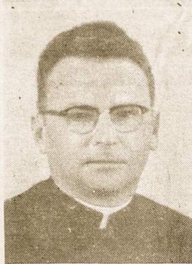
Kun. St. Saplys du kartu yra gyvenęs ir dirbęs Argentinoje.

1913 m. marijonai įsikūrė šiaurinėje Amerikoje, kur šiuo metu yra dvi provincijos: lietuvių šv. Kazimiero provincija ir lenkų marijonų - šv. Stanislovo Kostkos provincija. 1915 m. marijonai įsikūrė Lenkijoje, 1918 m. - Lietuvoje, 1923 m. - Gudijoje, 1924 m. - Latvijoje, 1925 m. -