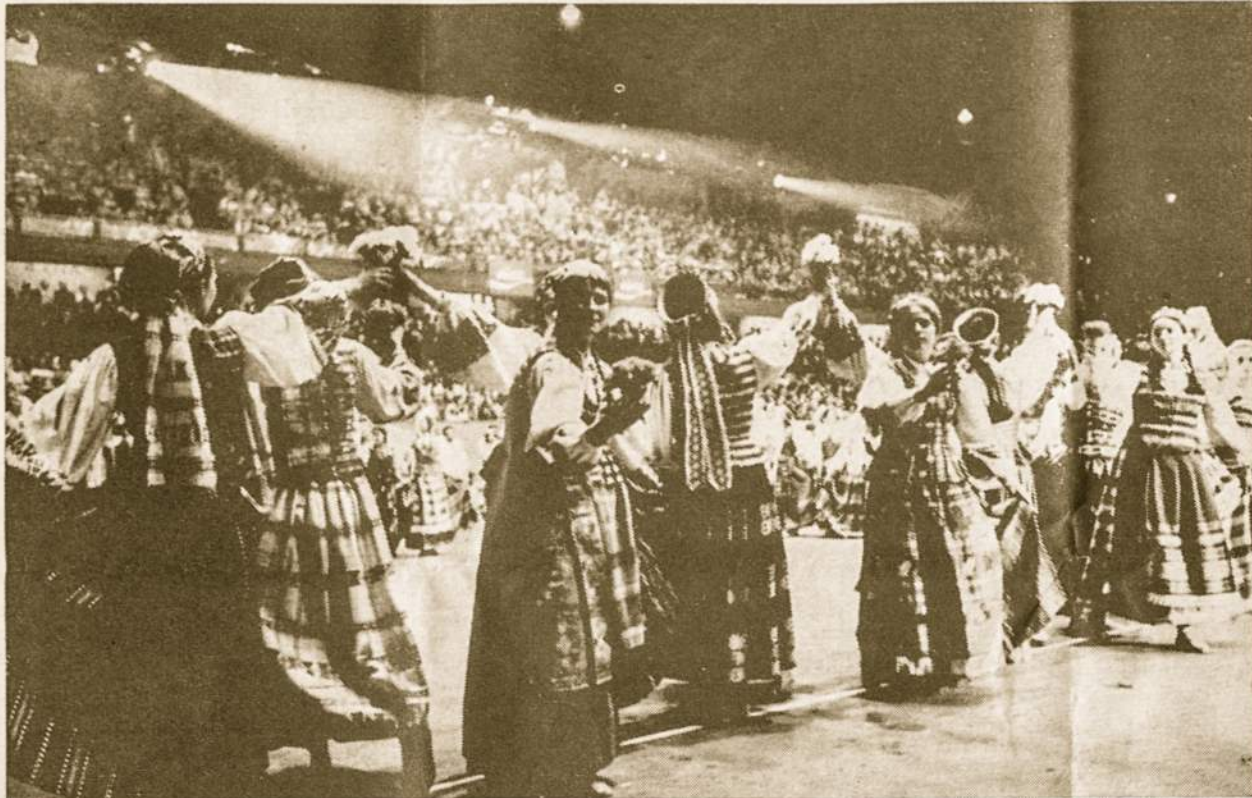
Vaidas iš didingo Tautinių Šokių festivalio. Kai kiti šoka, dalis jaunimo ilsisi ir laukia savo eilės. Šioje šventėje dalyvavo ir mūsų jungtinė šokių grupė "Eglė".