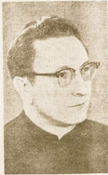
Kun. Pr. Garšva buv. klebonas ir redaktorius Avellanedoje.

Avellanedos marijonai šių metų gruodžio 8 d., švč. M. Marijos Nekalto Prasidėjimo šventėje, kartu su savo metine švente, ruošiasi paminėti Vienuolijos 300 metų sukaktį. Tos dienos vakare 8 valandą bus laikomos šv. mišios už gyvus ir mirusius marijonus, ypatingai už tuos, kurie yra darbavęsi Argentinoje.