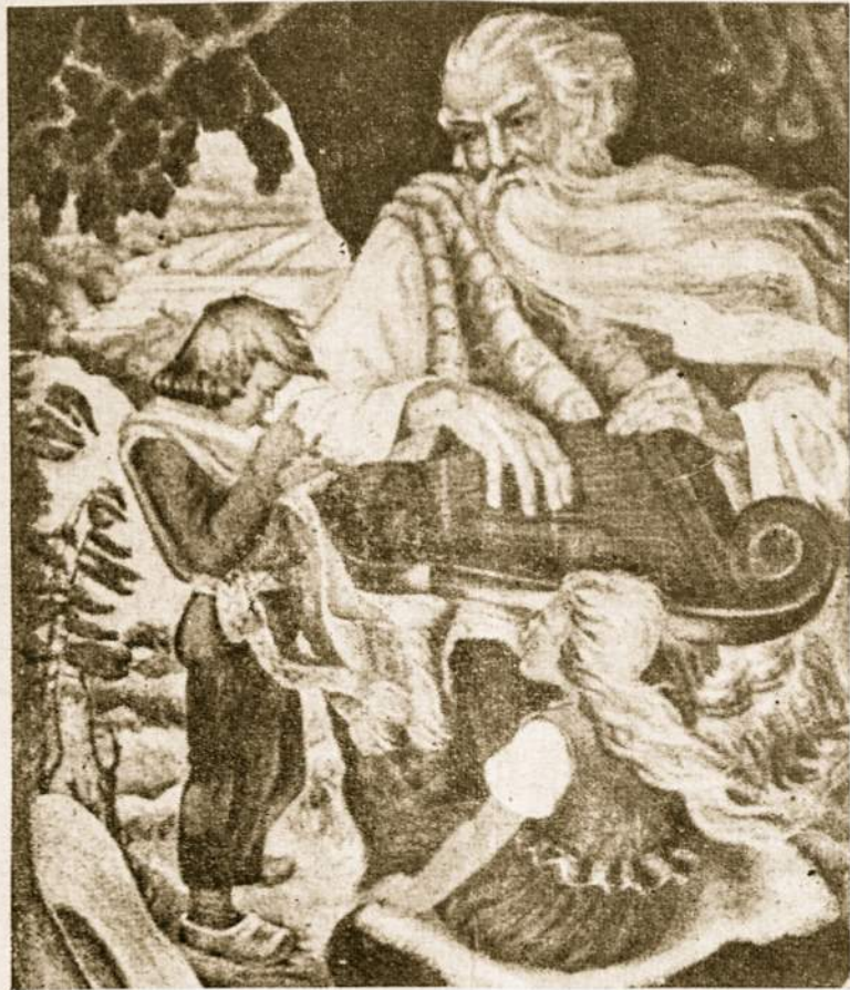
Gyvenimas yra lyg daina, kuri žmogų palaiko tobulame džiaugsmo ir kelia prie Dievo.

Linkėdami laimingų metų, mes išreiškiame savo širdies troškimą, kad kitas būtų laimingas, kad gyventų prasmingai ir džiaugsmingai.