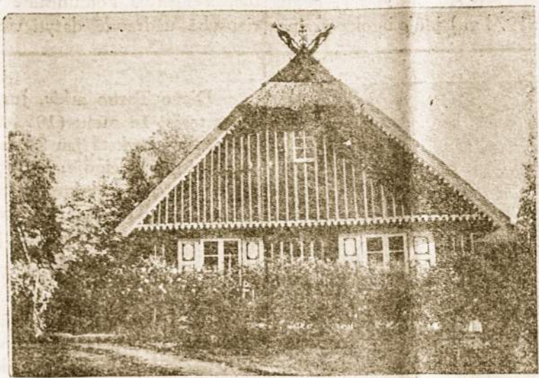
Lietuviškas ūkininko namelis su rūtų darželiu. Tokiuose namuose mes užaugom ir čia prabėgo mūsų jaunystės dienos.

vainikėlis jau nebelydi nuotakos ir bažnyčia. Greičiausiai tai šio krašto įtaka. Argentinoje auga rūtos, tik jos savo išvaizda yra skirtingos ir neturi lietuviškos romantikos, tai darželio patvorio mišiniškas krūmas, laikomas daugiau dėl savo sveikatingumo ir jis neprilygsta gražiesiems žaliems ir smulkiems lietuviškos rūtos lapeliams.