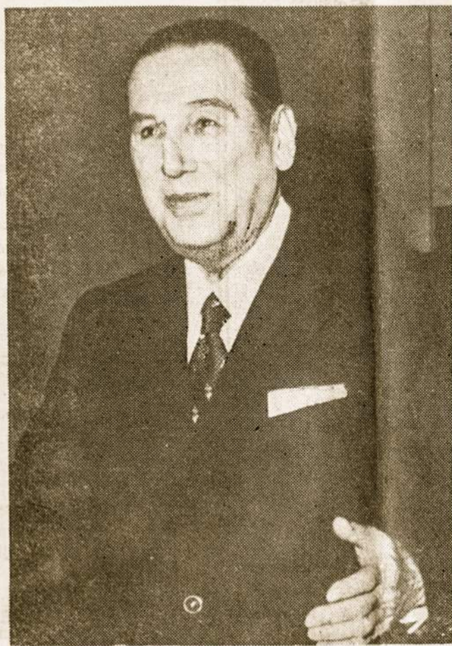
Argentinijos respub. prezid. Generolas Juan D. Peron, mirė š. m. liepos 1 d. Prezidentu tapo jo žmona - M. E. Martinez de Peron.

Rusai, kelerius metus darę pastangų įsitvirtinti Viduržemio jūroje, gavo trauktis, nes Suez kanale vėl komanduoja JAV. Tačiau, kaip ir Vietname, Kissinger tikros taikos neatnešė: žydai tebesipeša su "gerizeriais" Libane ir su arabais svaidosi grašiniams atnaujinti karą. Rusai masiniai tebegabena ginklus į Siriją, o JAV ginkluoja ir žydus, ir arabus. Keistai tad atrodo JAV džiaugsmas dėl Kissinger