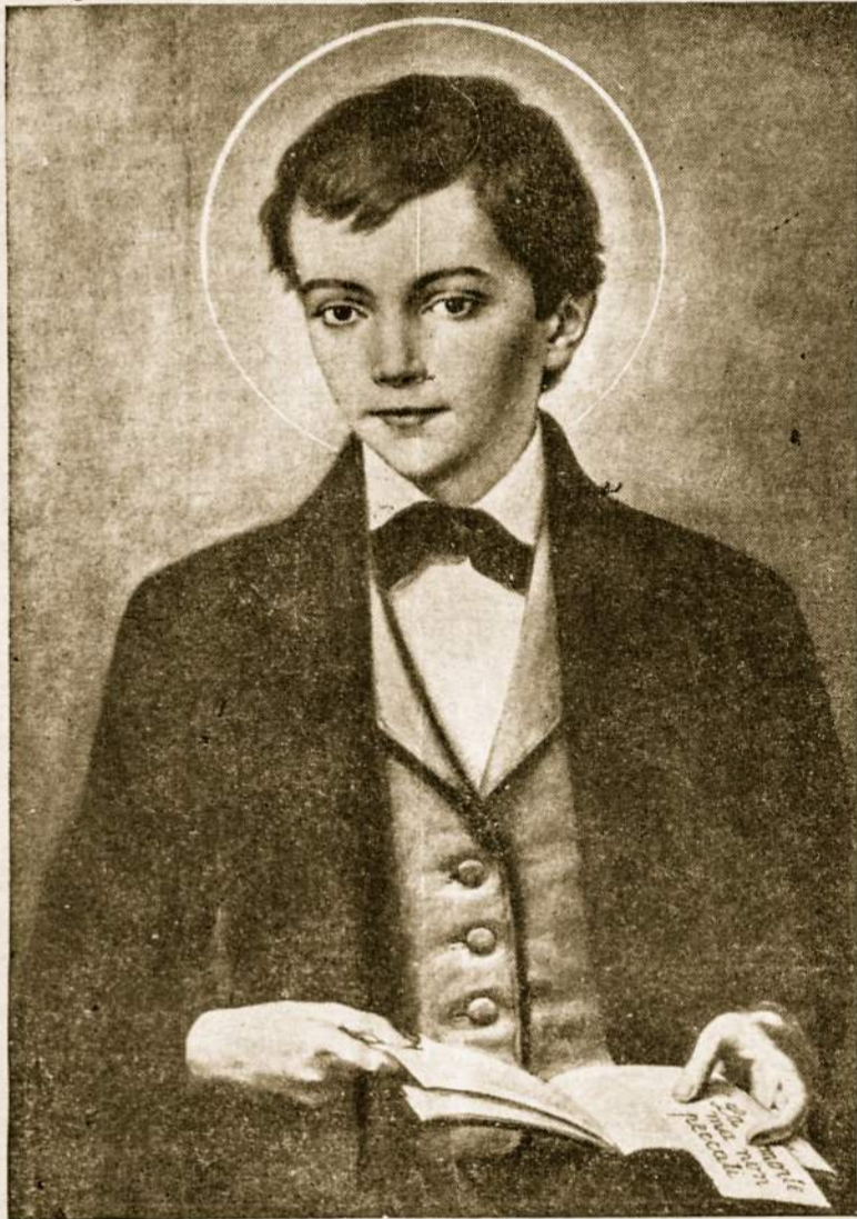
Domininkas Savio per 15 metų subrendo į pilną krikščionį, tapdamas šventuoju — jaunimo globėju.

Su dideliu įdomumu perskaičiau šią knygą ir apsidžiaugiau, kad pagaliau lietuvių kalboje pasirodė išsami knyga apie krikščionio pasauliečio misiją mūsų laikų sąmyšyje.