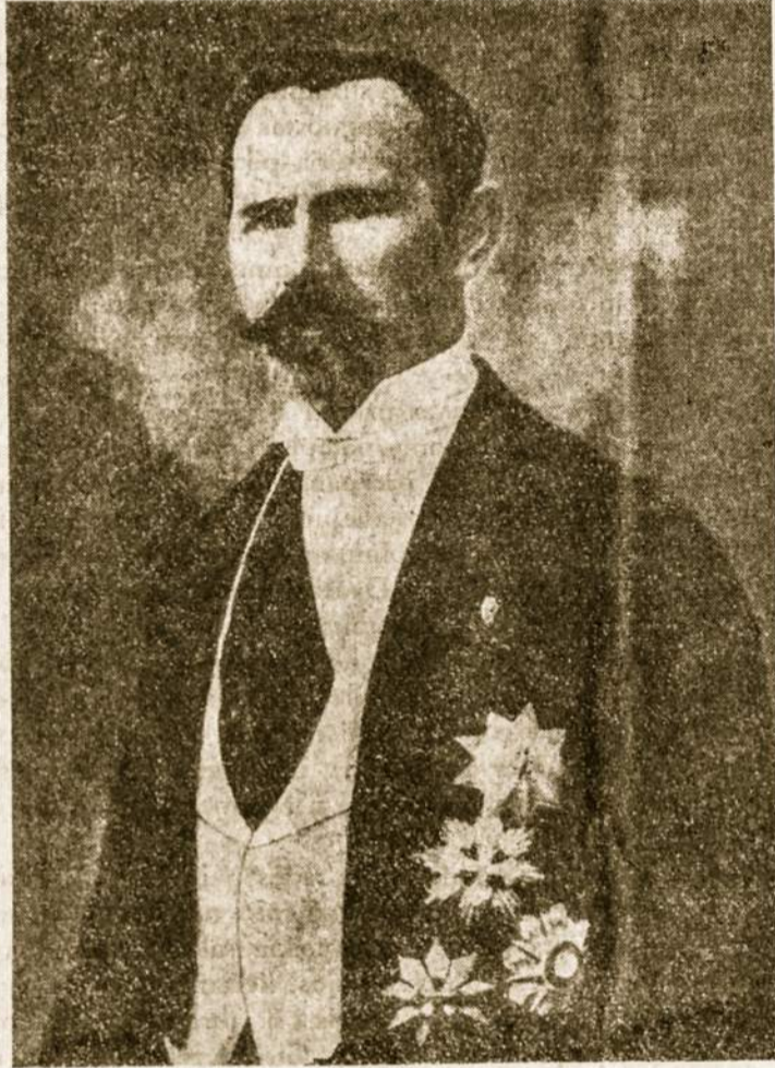
Lietuvos pirmasis ir paskutinis prezidentas Vasario 16-toš signataras.

Mokėsi Palangos progimnazijoje ir Mintaujos gimnazijoje.