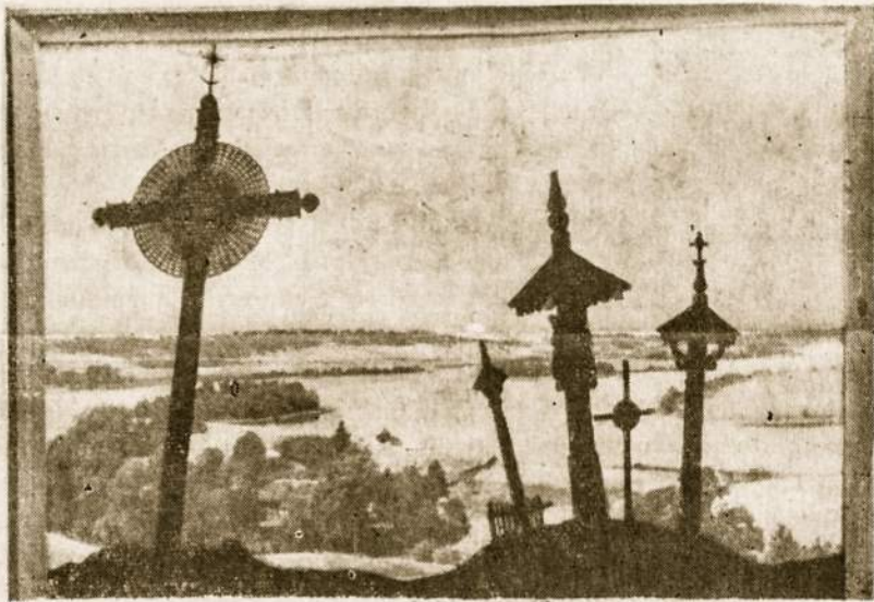
Prisimename savo mirusius Velinių dienoje. Nuotraukoje: Senos kapinės Lietuvoje.

Visuomet turima galvoje kas yra šiandien, ne kas buvo vakar ar kas bus rytoj. Pagal poterius: kasdienės mūsų duonos duok mums šiandien. Žmogus galėjo būti vakar turtingas, o šiandien labai vargšas.