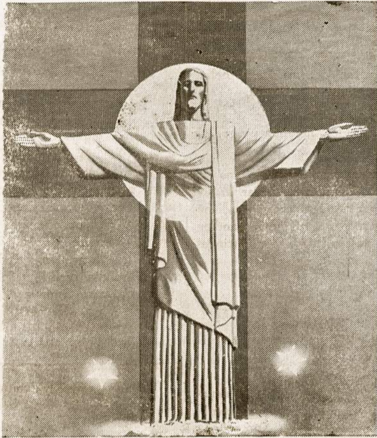
Kristau, gyvenk mūsų širdyse ir šeimose!

ko istorinėse dulkėse tūnoti ir niekas dėl jų daugiau jau nediskutuos ir niekas dėl jų savo galvos neguldys. Yra tik vienas asmuo, apie kurį sukasi ne tik diskusijos, bet verda kovos amžių bėgyje, už kurį tūkstančiai padėjo savo gyvybes, tai Kristus.