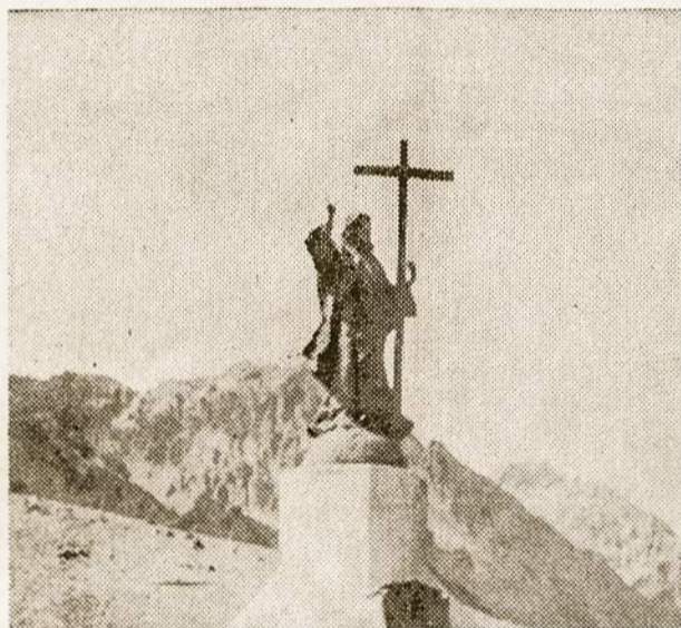
Andų kalnų viršūnėje Kristus Karalius — taikos ir ramybės nešėjas P. Amerikos kontinentui. (Statula išlieta iš patrankų švino).

Meksikos krikščionių persekiojimo laikais, kai buvo uždrausta skelbti Kristaus mokslą, visdėlto krikščionys ir kunigai nežiūrind draudimo susirinkdavo slapta į pamaldas ir meldavosi,