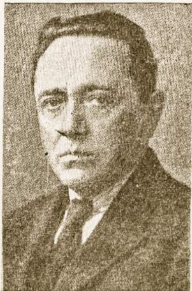
Poetas J. Baltrušaitis.

Nors Baltrušaičio poezija ir yra atidavusi didelę duoklę svetimai literatūrai, bet jis pats, visa jo galvosena ir net literatūrinės formos turi šaknis lietuviškoje žemėje. Tas lietuviškumas jį gaivino ir rusų kūryboje ir darė jį originaliu. Vienu kartu jis buvo išrinktas visos Rusijos rašytojų sąjungos pirmininku. Lietuvai atsistačius, buvo paskirtas Lietuvos atstovu Maskvoje, kur išbuvo iki 1939 metų. Pasizymėjo kaip gabus ir įtakingas di-