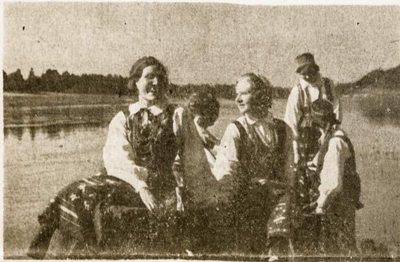
Jaunystė! Kodėl ji taip greit prabėgo?

Neteisinga būtų reikalauti, kad senstantis žmogus atmetų visus prisiminimus savo jaunystės patirties. Tikrai galima turėti malonumo ir paguodos žvelgiant į savo praeitį ir net reikėtų puoselėti sveiką pasididžiavimą savo praeities gyvenime atliktais kilniais darbais, bet idealizuoti ir garbinti savo praėjusį gyvenimą reikėtų vengti. Ypač svarbu nenumoti ranka į savo amžiaus reikalavimus ir gyventi vien praeitimi.