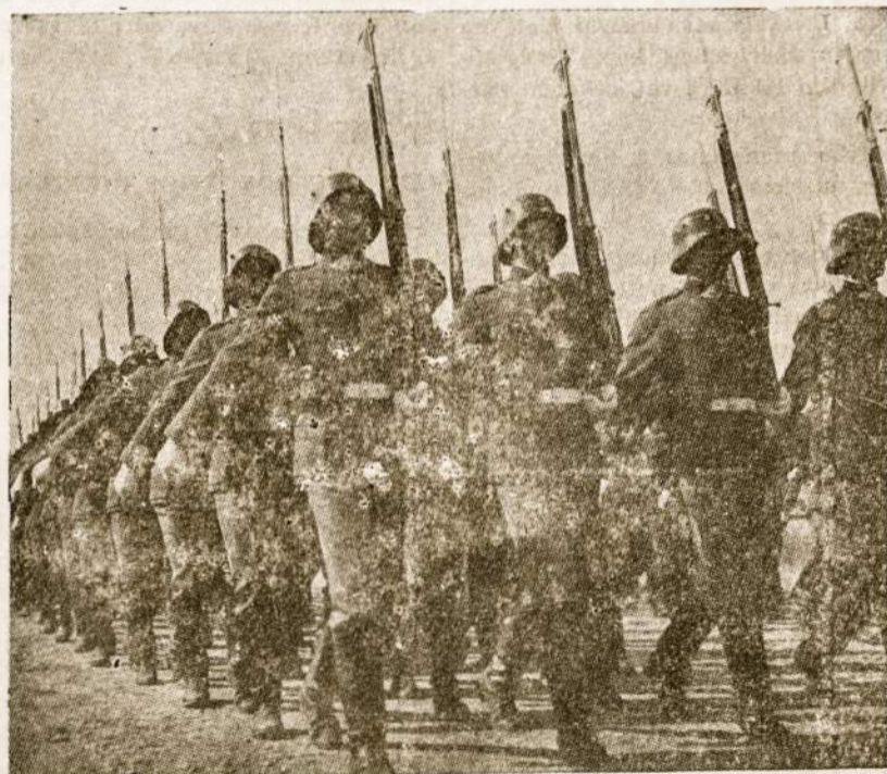
Marš, marš, kareivėliai... Lapkričio 23 d. švęsdami Lietuvos Kariuomenės Dieną, sveikname visus buvusius mūsų kareivėlius!

• Japonijos ministerių pirmininkas Tanaka atsisako nuo savo vietos, vadovauti ministerių kabinetai. Prieš kurį laiką japonų spauda pradėjo pulti Tanaką dėl finansinių ir moralinių skandalų. Tai buvo japoniškas "Watergate", dėl kurio Tanaka buvo priverstas atsistatydinti.